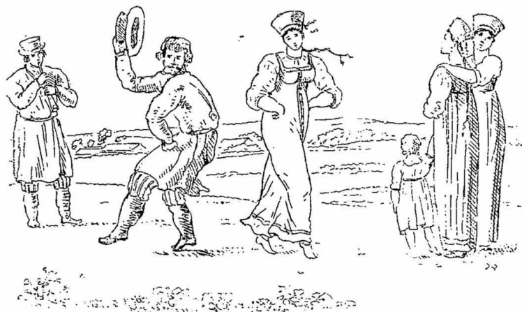
Деревенскія сцены (рис Мартынова).

лался мясникомъ, когда мясникъ сталъ бить въ лобъ, то, не стерпя его удара, ткнулъ рогами въ бокъ, а мясникъ съ ногъ долой свалился,—то быкъ выхватить топоръ у него потщился; отрубивши ему руку, повѣсилъ его вверхъ ногами, и сталъ таскать кишки съ потрохами“,—текстъ этотъ казался тогдашнимъ цензорамъ намекомъ на расправу крѣпостныхъ крестьянъ со своими господами „за жестокое обращеніе“. Что подъ ударами, сыпавшимися съ разныхъ сторонъ, безвозвратно погибло много сатирическихъ пѣсень, въ этомъ нельзя сомнѣваться. Но не только въ неблагопріятныхъ внѣшнихъ условіяхъ кроется причина того, что намъ извѣстно сравнительно ничтожное количество „крѣпостныхъ“ пѣсень. Съ уничтоженіемъ крѣпостной неволи цензурныя препоны уже не мѣшали появленію въ печати подобныхъ произведеній народной поэзіи. Думается, вина отчасти лежитъ и на этнографахъ, бросившихся съ 60 годовъ преимущественно на сѣверъ, въ край старинокъ,