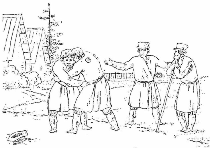
Деревенскія сцены (рис. Мартынова 20 гг.).

могущественнѣе. Въ концѣ 50 годовъ о свободѣ говорила крестьянину даже телеграфная проволока, только что протянувшаяся по уѣздному тракту; по свидѣтельству Фета, крестьяне говорили тогда, что это тянуть имъ изъ Петербурга волю. Неужели же эти народныя настроенія не отразились въ его поэзіи? И если они должны были сказаться въ ней, то почему у насъ такъ мало пѣсенныхъ отраженій крѣпостной эпохи? Главной причиной малаго количества народно-поэтическихъ откликовъ на панщину 1) является та „инквизиціонная опека“, которая долго тяготѣла надъ народной пѣснью, народнымъ сатирическимъ творчествомъ. Внѣшнія неблагопріятныя условія мѣшали какъ сложенію подобныхъ пѣсень, такъ и появленію ихъ въ печати. Еще въ Московской Руси духовная и свѣтская власти дружно объявили походъ противъ народной пѣсни, запрещали „глумы и кошуны“, предписывали „не чинить