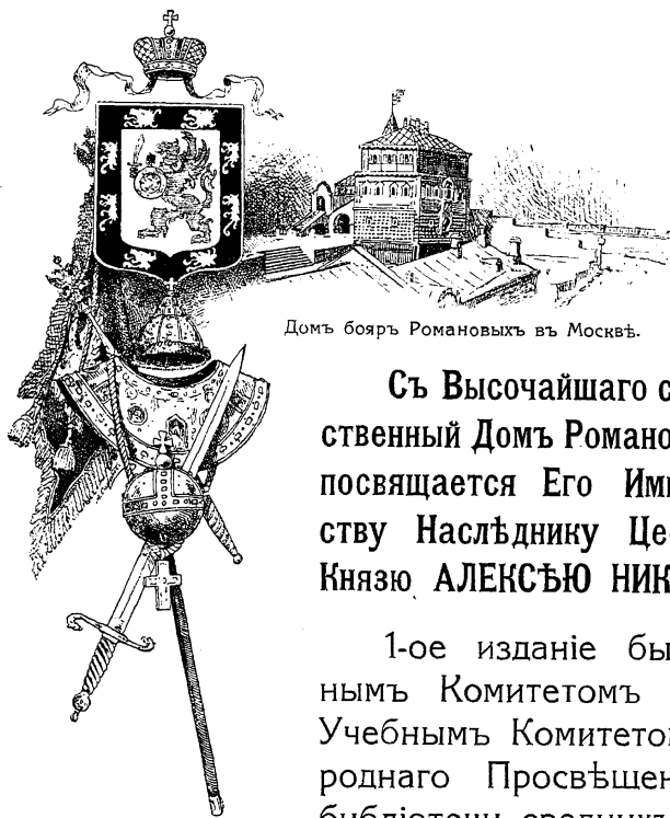
Домъ бояръ Романовыхъ въ Москвѣ.

Съ Высочайшаго соизволенія книга „Царственный Домъ Романовыхъ“ Всепреданнѣйше посвящается Его Императорскому Высочеству Наслѣднику Цесаревичу и Великому Князю АЛЕКСѢЮ НИКОЛАЕВИЧУ.