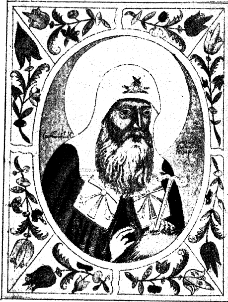
Патріархъ Гермогенъ. Скончался 17 февраля 1612 г.

московскій, принялъ православіе. Когда же Гермогенъ узналъ, что король польскій не только не отпускаетъ своего сына на царство, но еще самъ хочетъ быть царемъ въ Московскомъ государствѣ, онъ понялъ, какая опасность грозитъ Русской землѣ, и всѣхъ молилъ не допустить отечество до гибели. Но, несмотря на увѣщанія, среди московскихъ бояръ нашлись такіе, которые перешли открыто на сторону врага Россіи—короля Сигизмунда. Тогда и Гермогенъ сталъ открыто призывать