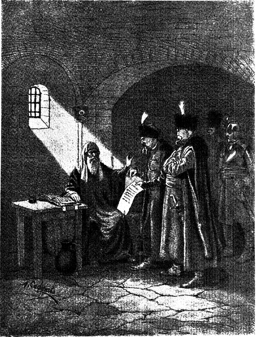
Патриарх Гермогенъ отказываетъ полякамъ отозвать русское ополченіе отъ Москвы.