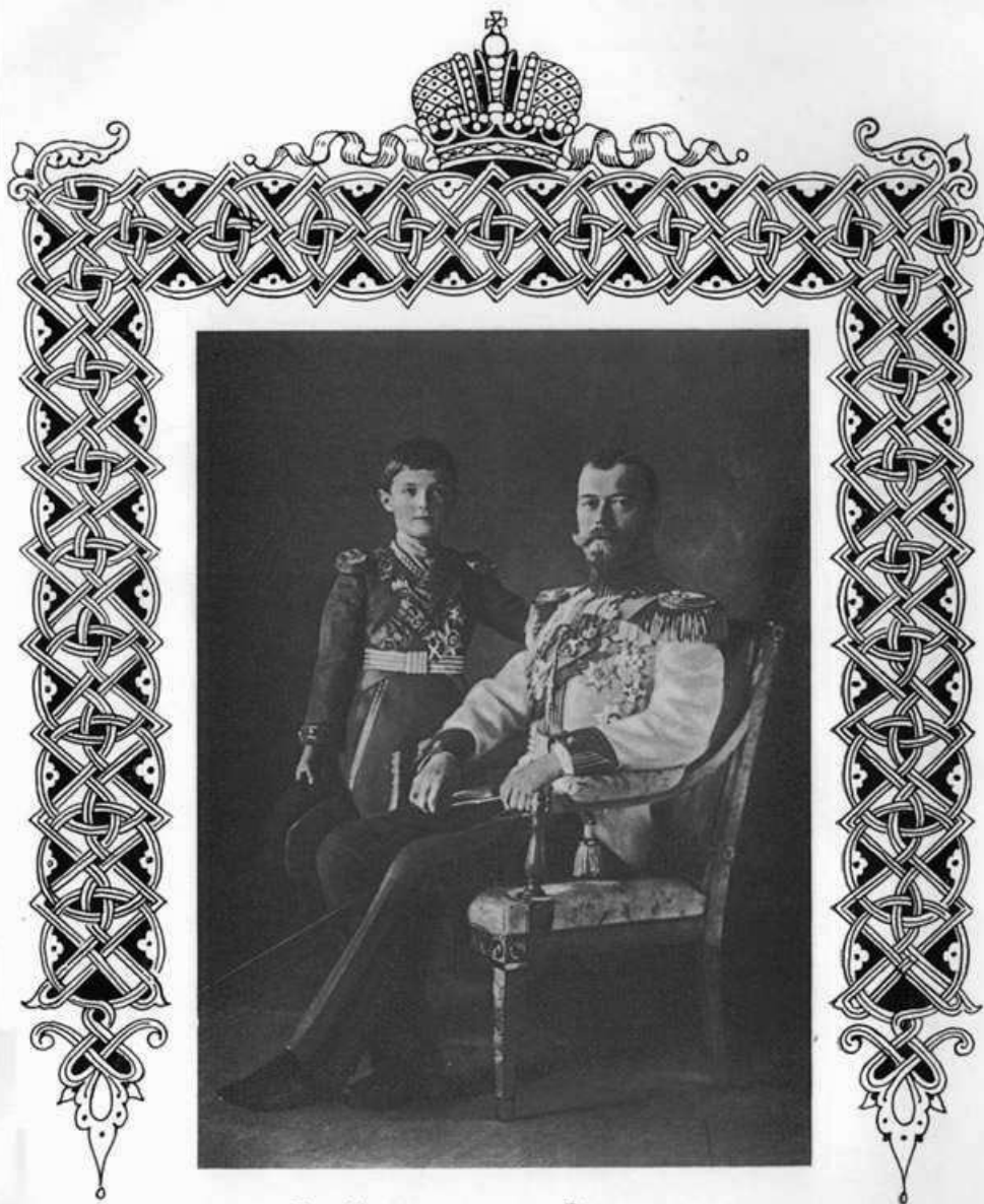
Его Императорское Величество нынѣ благополучно Царствующій Государь Императоръ НИКОЛАЙ АЛЕКСАНДРОВИЧЪ съ Наслѣдникомъ Цесаревичемъ и Великимъ Княземъ АЛЕКСѢЕМЪ НИКОЛАЕВИЧЕМЪ.