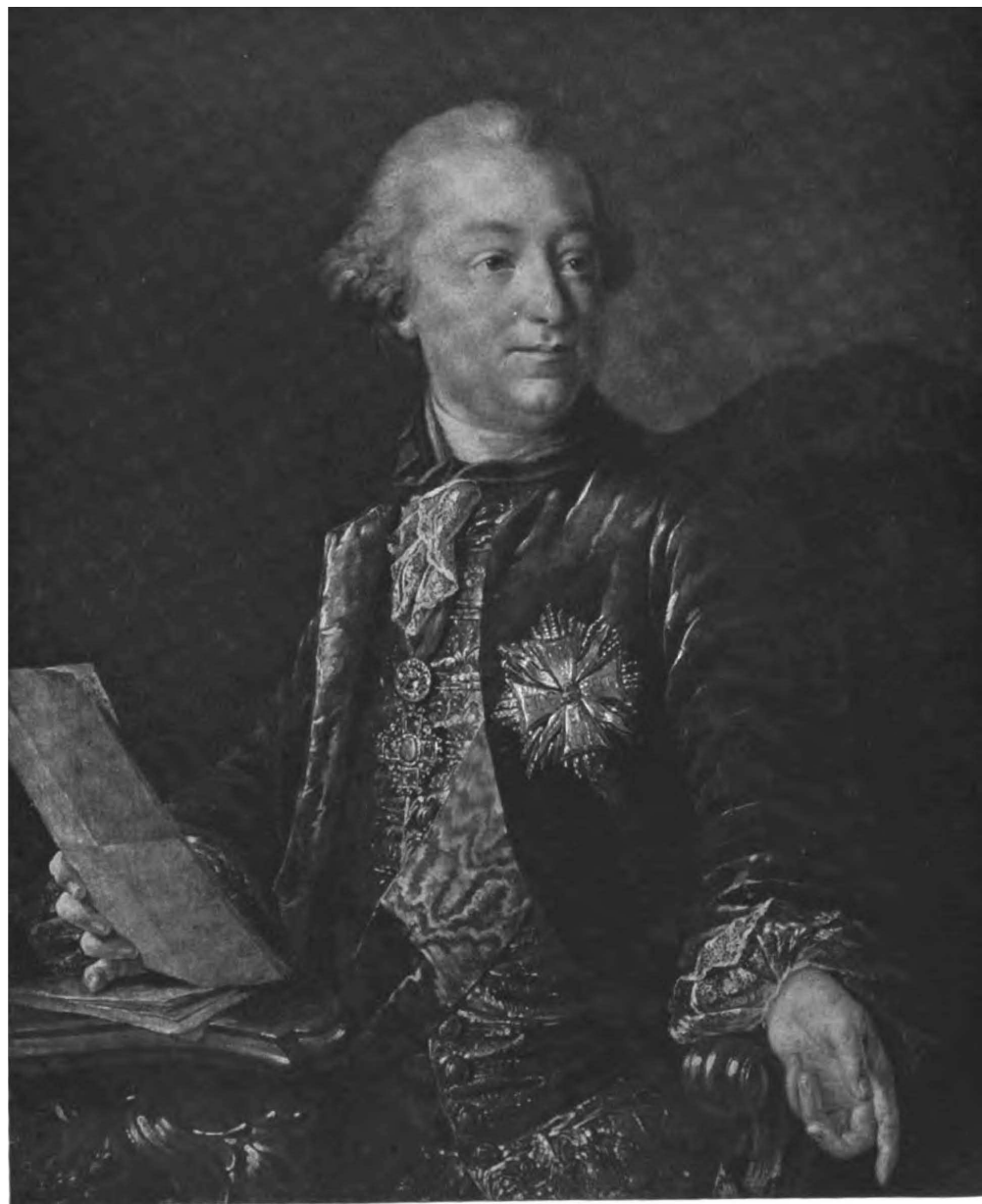
И. Н. Шуваловъ (съ портрета Токера, находящагося въ залѣ Совета Академіи).