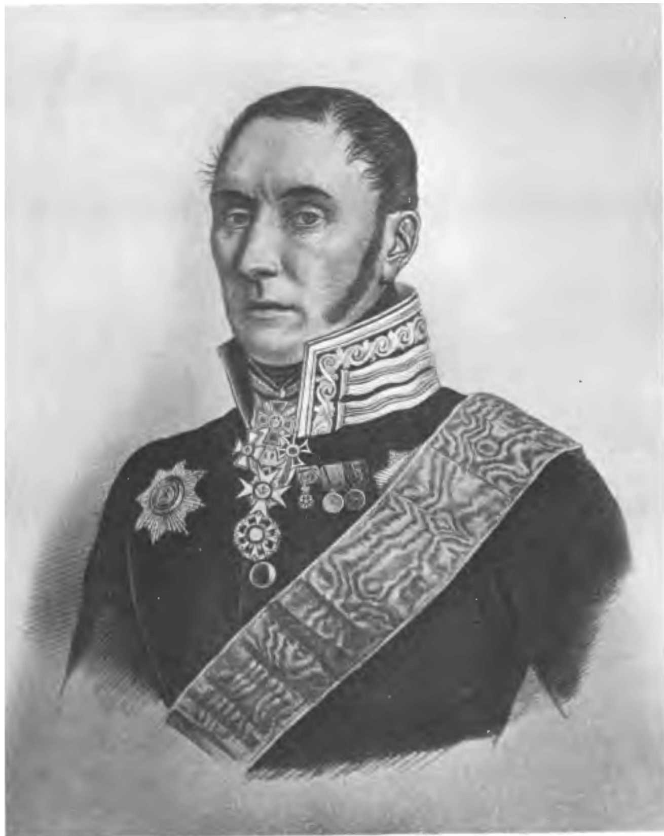
Президентъ Мед.-Хир. Академіи Лейбъ-Хирургъ баронетъ Я. В. ВИЛЛІЕ.