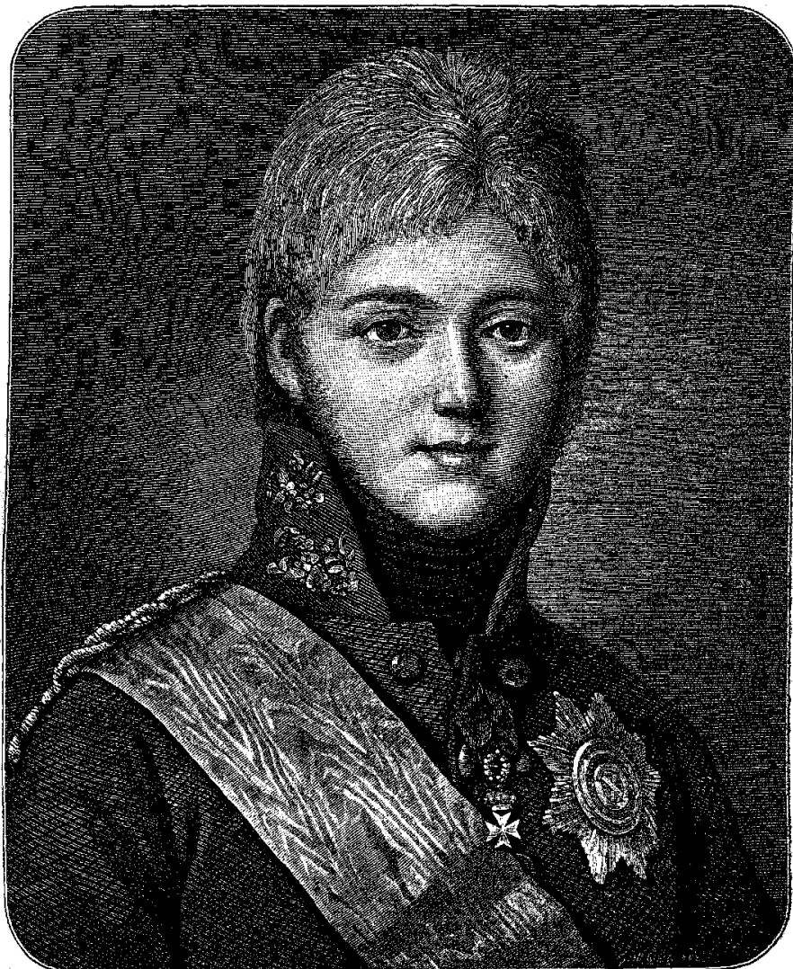
Императоръ Александръ I въ 1802 году.

другъ другу и не обманывались. Какой-то дух искренняго братства господствовалъ въ столицахъ; общее бѣдствіе сближало сердца и великодушное остервенѣніе противъ злоупотребленій власти заглушало голосъ личной осторожности 13 . Вотъ дѣйствіе Екатеринина человѣколюбиваго