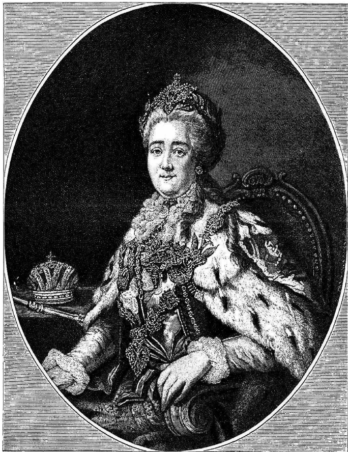
Императрица Екатерина II.

Загѣмъ начался цѣлый рядъ великолѣпныхъ придворныхъ и народныхъ празднествъ, данныхъ императрицею и ея вельможами. «До поста осталось какихъ нибудь двѣ недѣли», писала въ февралѣ 1778 года Екатерина Гримму, «и между тѣмъ у насъ будетъ одиннадцать маска-