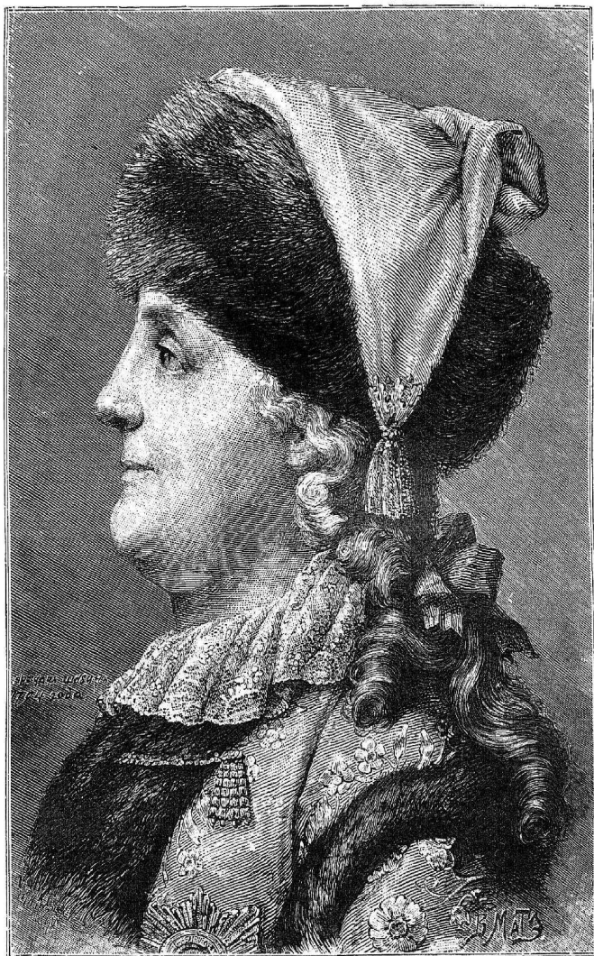
Императрица Екатерина II въ 1794 году.

Съ портрета того времени, сдѣланнаго съ натуры карандашомъ Шубниковъ.