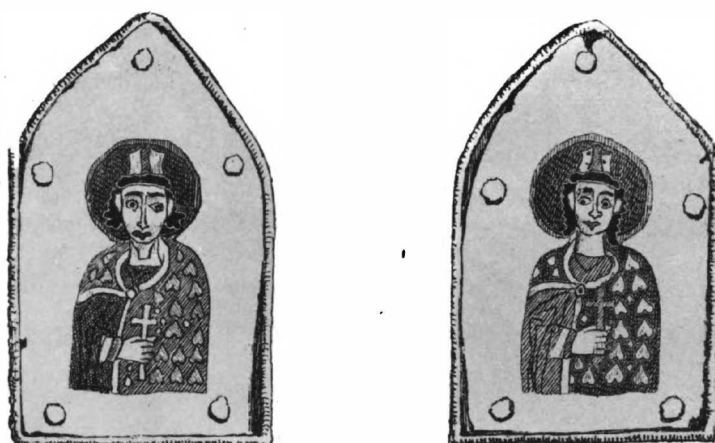
Въ окаяна Метиславова Вѣнчелѣа, до 1117 года.