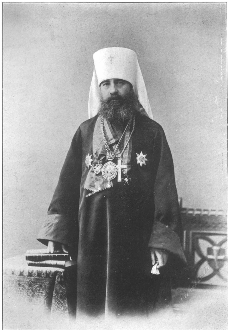
Иерархический членъ Св. Синода

Антонъ Митрополитъ С. Петербургскій и Новгородскій.