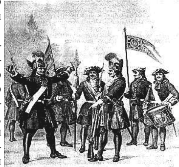
Гренадёр, обер-офицер, пикинёр и барабанщик Преображенского полка

К началу 90-х годов Петр сформировал из « потешных » два полка – Преображенский и Семёновский (назвали их по названиям сел, где они располагались). Со временем под Преображенским происходили, по заранее намеченным диспозициям, настоящие сражения между « армией » князя Ф.Ю. Ромодановского и стрельцами полками И.И. Бутурлина – с десятками тысяч участников, артиллерийской стрельбой, убитыми и ранеными. Так выковывались кадры будущей Гвардии, регулярной российской армии.