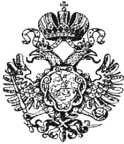
Печать Петра I, 1721 г.

Была та смутная пора, Когда Россия молодая, В бореньях силы напрягая, Мужала с гением Петра.