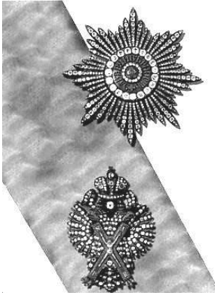
Орден Св. апостола Андрея Первозванного и Звезда

Теперь уже есть кому строить российский флот - и в мае 1702 г. состоялось основание первой кораблестроительной верфи Балтийского флота в устье р. Сясь (близ Ладоги) и закладка на ней первых военных судов – фрегат-ов (кораблей, имевших 40-50 орудий и команду 300-500 человек на каждом), а 16 мая 1703 г. состоялась закладка в устье р. Невы Петропавловской крепости и города Санкт-Петербурга.