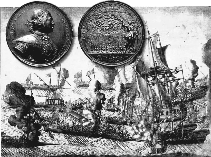
Битва при Гангуте. 1714 г. Худ. А. Зубов, 1721 г. и медаль

написывать достойны явились. Таковых потех употребил ЕГО ВЕЛИЧЕСТВО в детстве своём, которые его и многих при нем благородных сверстников обучали строить забавочные крепости, сочинять бои на подобие прямого бою с неприятелями, наступательно и оборонительно, как и помянутый ботик не к детскому только гулянью послужил ему, но подал вину к великому флота строению, каковое уже видим ныне со удивлением.