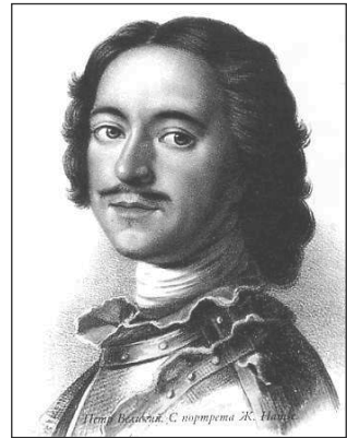
Петр Великий. С портрета Ж. Натье

На четвёртом году жизни Петр потерял отца. Началась долгая придворная борьба за престол. Подросший Петр в политические дела не вмешивался. Жил он с матерью в селе Преображенском. Основное своё внимание в эти годы Петр отдавал воинским играм, « потехам ». К ним он привлёк целую толпу сверстников и « робяток » постарше. От покойного отца остались целые службы по конюшенному ведомству, по соколиной охоте. Всех сокольников, стольников и прочих, он собирал в батальоны своих « потешных ». Помимо знатного люда, включал в их ряды и бывших холопов, прочих « простецов ». Лишь бы были они людьми шустрými, весёлыми и исполнительными. Так собралась довольно пёстрая группа – два батальона, примерно по 300 человек. Среди « потешных » были князь М.М. Голицын (службу начал барабанщиком, а в Полтавскую битву командовал Гвардией – лейб-гвардии Семёновским и Преображенским пол-