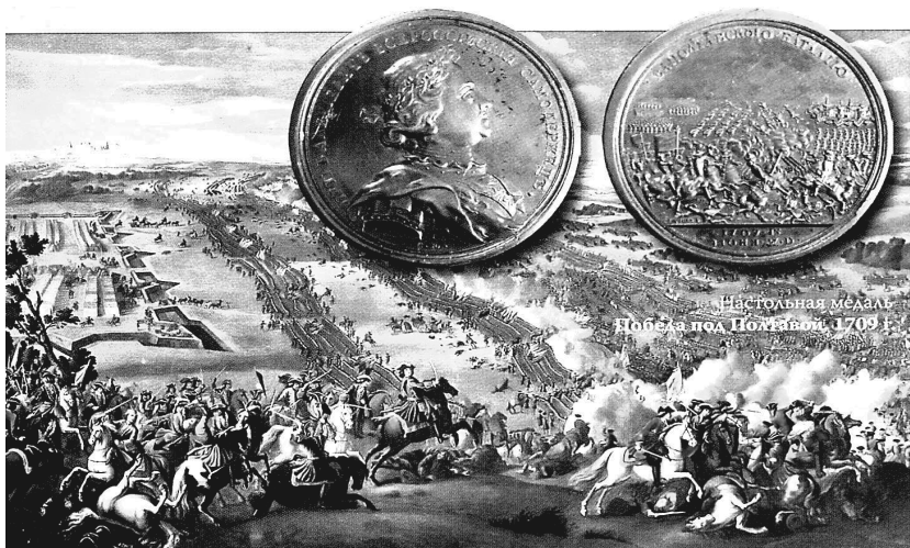
Полтавская битва. Худ. Денис Мартен, 1726 г. и медаль

Офицерам армии и флота запрещалось носить штатскую одежду во всех случаях – это считалось оскорблением формы. Они не имели права участвовать в митингах и шествиях, а также произносить политические речи. Жениться им можно было только по разрешению начальства, обязанного рассмотреть «пристойность брака». Всему офицерскому корпусу в обязательном порядке предписывалось носить усы.