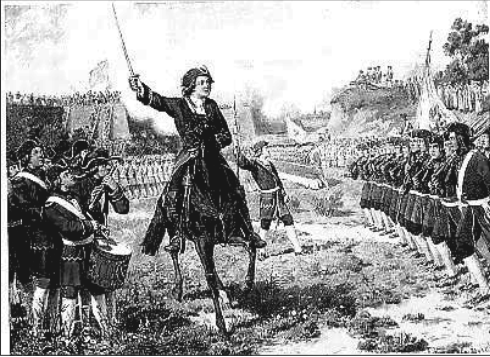
Военная игра потешных войск Петра. А.Д. Кившенко

ками, генерал-фельдмаршал), князь А.И. Репнин (полководец, в Полтавской битве командовал центром русской позиции, генерал-фельдмаршал), Ф.М. Апраксин (потом всю жизнь посвятил строительству Российского флота, отличился в Гангутском морском сражении, первым удостоен высшего военноморского чина – генерал-адмирала), потомок знатного московского рода И.И.