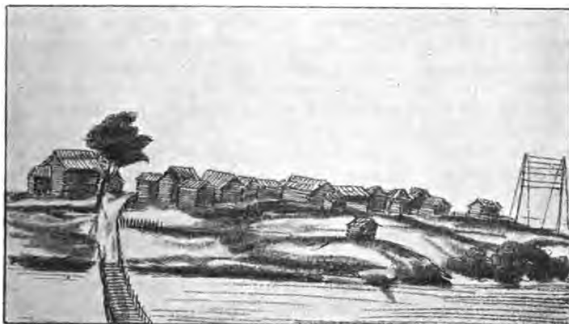
Деревня XVII вѣка изъ окрестностей Москвы. (Альбомъ Мейерберга).

Мы не можемъ изслѣдовать русскую народную словесность, какъ таковую, во всемъ томъ безграничномъ ея разнообразіи, въ какомъ она жила и развивалась, скажемъ, отъ момента образованія русскаго языка, со всѣми его говорами и большими тремя языковыми отдѣлами, до нашихъ дней. Нѣтъ, мы можемъ изслѣдо-