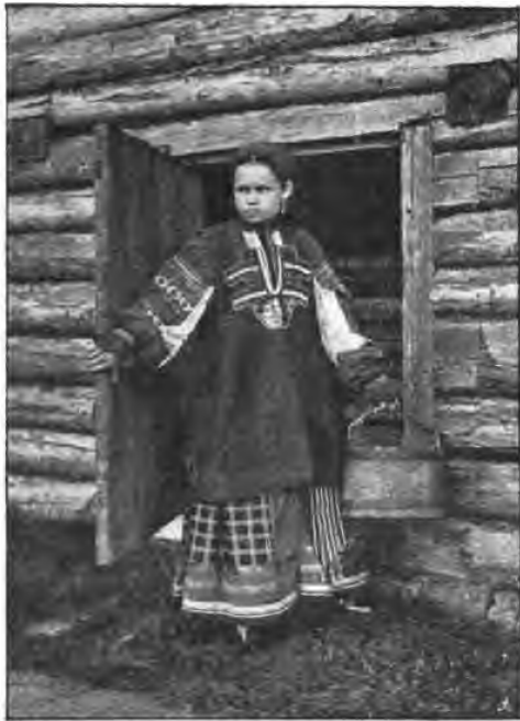
Дѣвушка Тульской губерніи. (Въ коллекціи Этнографическаго Музея при Академіи Наукъ).

значить ли это, чтобы вот эта именно оригинальность замысла каждого исполнителя породила неустойчивость народной поэзии? Отнюдь нѣтъ. Мы приступаемъ тутъ къ основной ея особенности, къ, казалось бы, взаимно противорѣчающимъ другъ другу свойствамъ народнаго творчества: къ его полной свободѣ, съ одной стороны, и полной непоколебимой традиционности—съ другой. Взаимодѣйствие того и другого—вотъ разгадка тайны о народной поэзии. Исполнитель свободенъ; онъ—поэтъ - импровизаторъ, онъ заново возстановляетъ образы и,