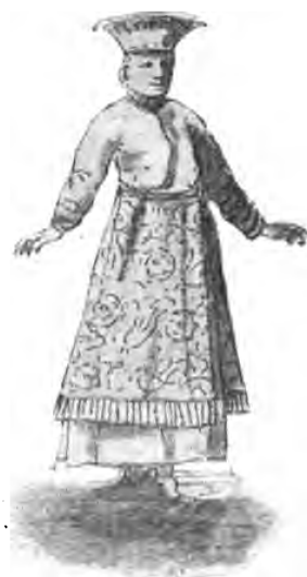
Молодая дѣвушка XVII вѣка. (Альбомъ Мейерберга).

У милого жалости было, Сняли меня, дѣвушку, съ моря