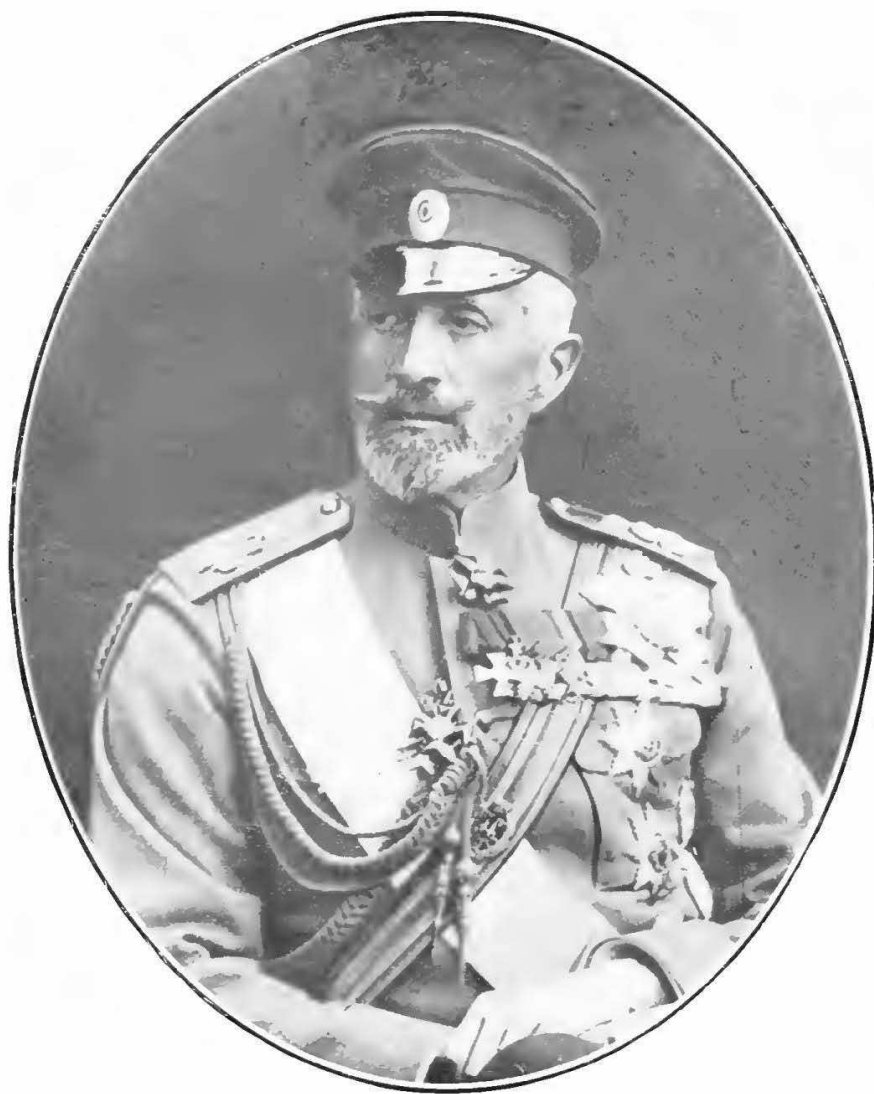
Его Императорское Высочество Великій Князь Николай Николаевичъ.