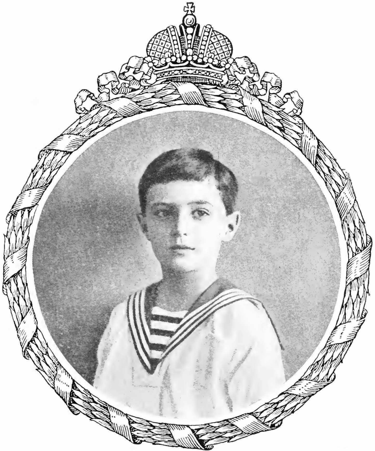
Его Императорское Высочество Наслѣдникъ Цесаревичъ Алексѣй Николаевичъ.