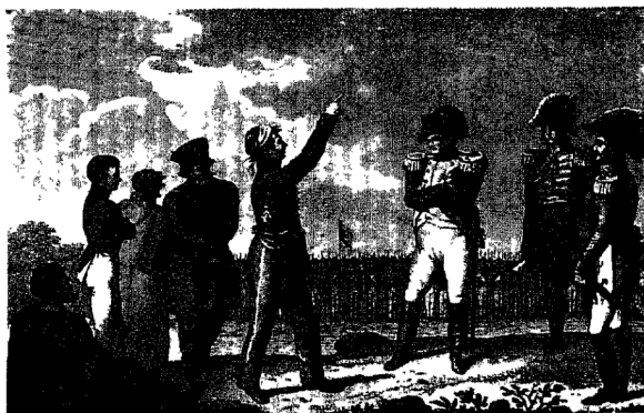
Къ № 418 (3).

Виньетка на первомъ грав. загл. листѣ и по одной гравюрѣ внѣ текста при каждой части. Этотъ романъ былъ изданъ дважды въ томъ же 1830 г. 1) Грав. загл. листъ („Димитрій Самозванецъ. Спб. 1830“. Виньетка изображаетъ медаль Димитрія съ его портретомъ, грав. К. Афанасьевъ). 2) Картинка представляетъ Димитрія въ монашескомъ платьѣ и Ц. Бориса. Грав. Галактіоновъ. 3) Картинка представляетъ Самозванца, бросающаго Калерію въ Днѣпръ. Грав. И. Ческій. 4) Картинка изображаетъ Самозванца и Марину Мнишекъ въ саду Самборскаго замка. Грав. С. Галактіоновъ. 5) Картинка изображаетъ Самозванца съ польскою дружиною и Русскихъ бояръ, подносящихъ хлѣбъ-соль подъ Москвою. Dav. Weiss sc. Viennae. Всѣ рисунки исполнены Зеленцовымъ.