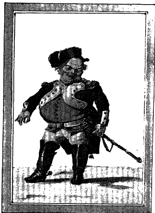
Къ № 404 (12).