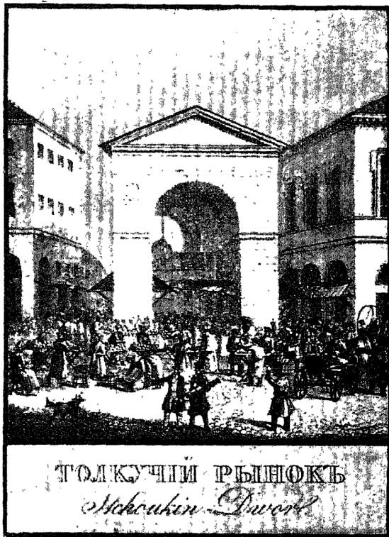
Къ № 411.

Книга печатана славянскимъ шрифтомъ. На оборотѣ загл. листа, приведеннаго выше, рамка, рѣз. на деревѣ, въ которой изобра- жено нѣсколько цвѣтовъ; въ рамкѣ надпись: „яко цвѣтъ селный—такъ цвѣтеть человекъ“. Подъ виньеткою обращеніе къ юнымъ учени-