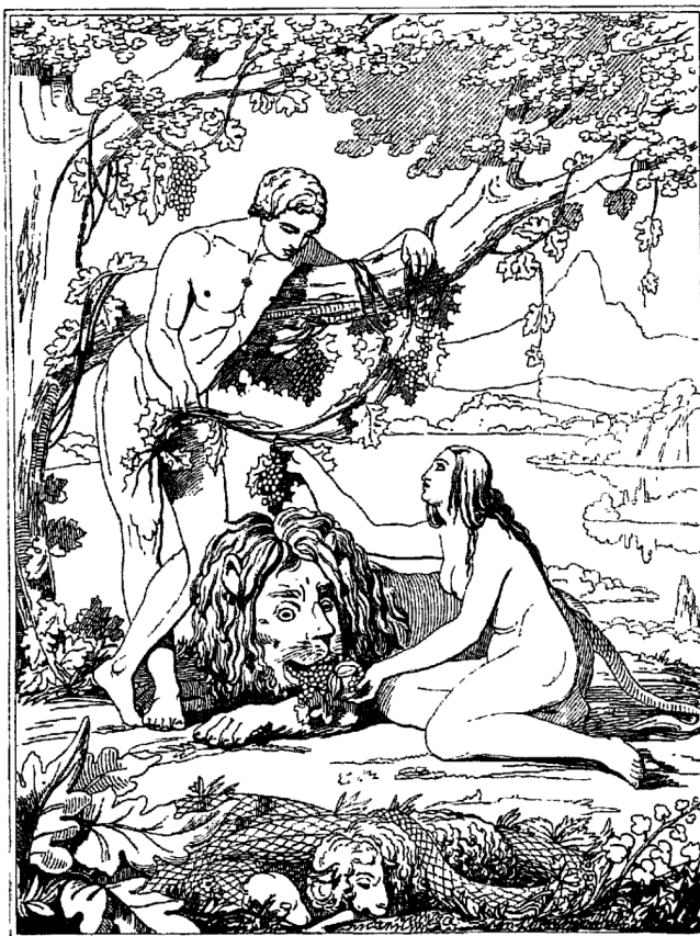
Къ № 424 (4).

82 гравюры, рис. А. Агинымъ и грав. К. Афанасьевымъ, въ контурахъ съ легкими тѣнями.