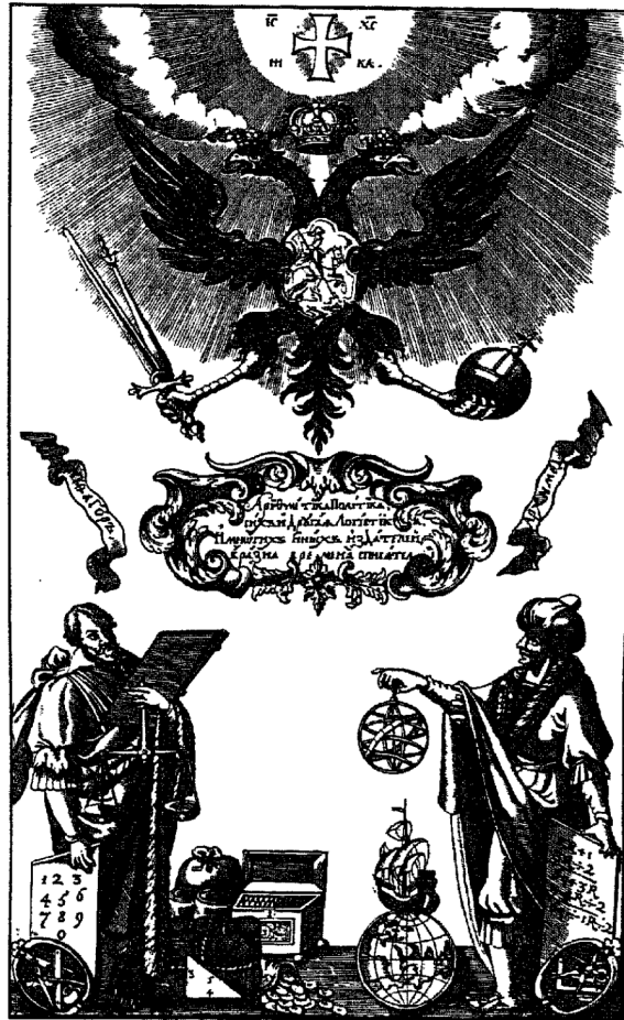
Къ № 408.

Два заглавныхъ листа, изъ которыхъ одинъ гравированъ, виньетка, грав. пунктиромъ и изобр. женскую головку въ облакахъ. На гравированномъ листѣ выставленъ 1825 г.