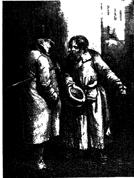
Къ № 419 (2).