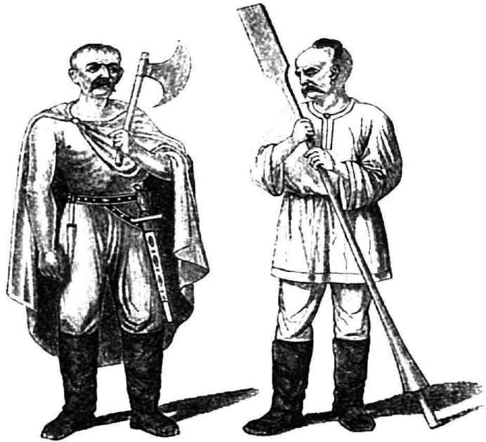
Русскія одежды X вѣка.

7. Введеніе христіанства. Торговля сношенія Русскихъ съ другими народами служили имъ на пользу не только потому, что они кормились этой торговлей, а иные и богатѣли отъ нея. Сходясь съ народами болѣе образованными, особенно съ Греками и Дунайскими Болгарами, предки наши перенимали у нихъ образованность ихъ и вѣру христіанскую. Уже въ половинѣ X вѣка было много христіанъ на Руси, особенно въ Кіевѣ. Тамъ была православная церковь св. Іліи. Въ числѣ