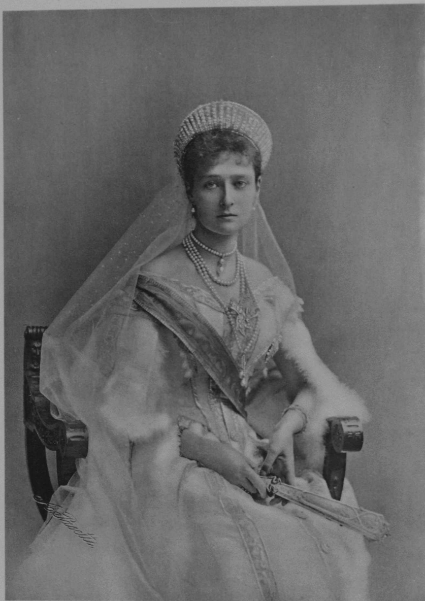
Ея Императорское Величество Государыня Императрица Александра Феодоровна.