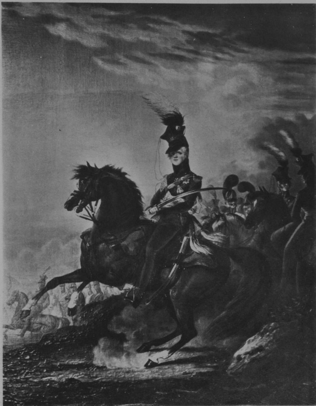
Его Императорское Высочество Великий Князь Цесаревичъ Константинъ Павловичъ.