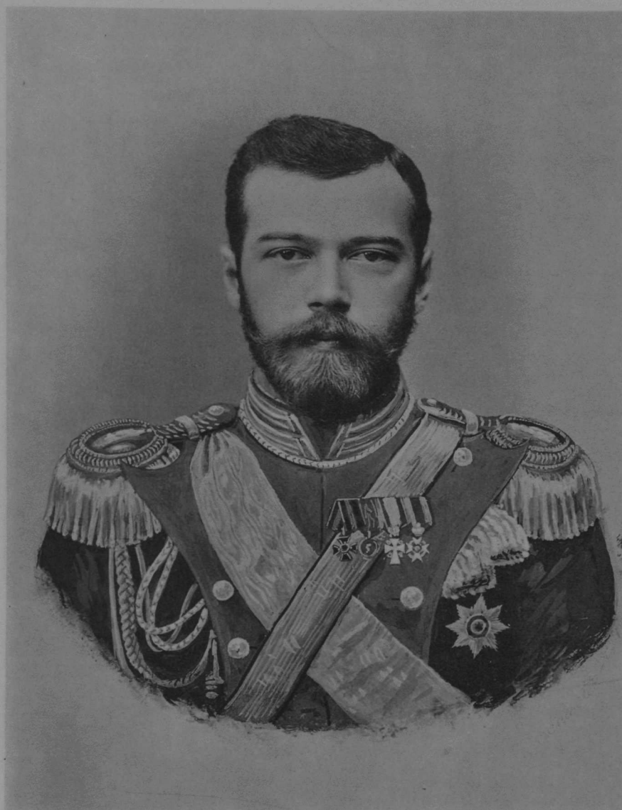
Его Императорское Величество Государь Императоръ Николай Александровичъ..