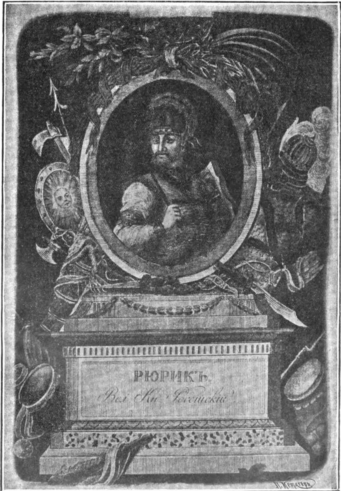
Великій Князь Рюрикъ родился въ городѣ Угличѣ въ 830 г. † въ Новгородѣ въ 879 г., гдѣ и погребенъ.