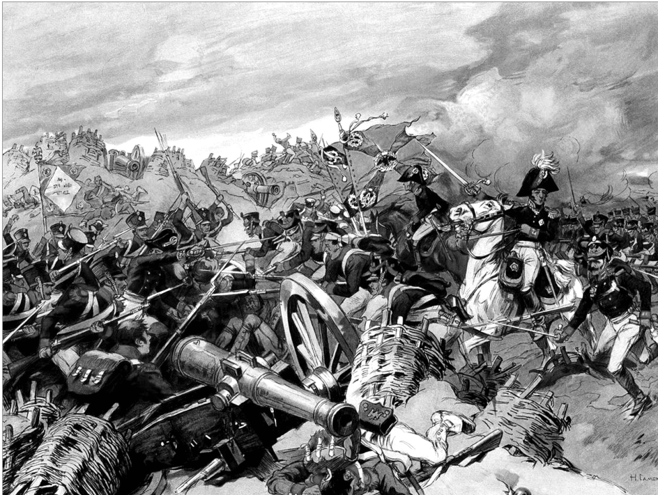
Художник Н. Н. Самокиш, 1910 г.