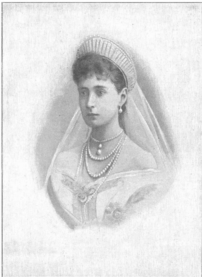
ЕЯ ИМПЕРАТОРСКОЕ ВЕЛИЧЕСТВО ГОСУДАРЫНЯ ИМПЕРАТРИЦА Александра Феодоровна АВГУСТЪЙШАЯ СУПРУГА ГОСУДАРЯ ИМПЕРАТОРА.