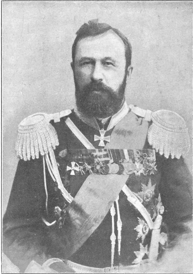
Его Превосходительство Генералъ-Лейтенантъ Куропаткинъ Военный Министръ.