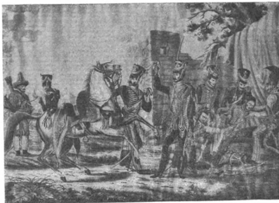
СМЕРТЬ ГЕНЕРАЛЪ - МАІОРА Я. П. КУЛЬНЕВА.

Во время рассказанныхъ событій произошли крупныя бои въ отдѣльномъ корпусѣ графа Витгенштейна, стоявшаго на путяхъ къ Петербургу. Здѣсь 18 — 21 іюля разыгрались бои у Клястиць, Боярщины и Головичи; въ бою 20 іюля убитъ отважный генералъ Кульневъ (с.м. картину № 4 и объясненіе къ ней).