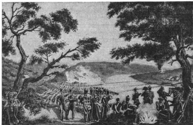
ПЕРЕХОДЪ АРМІИ НАПОЛЕОНА ЧЕРЕЗЪ Р. НѢМАНЪ 12 ІЮНЯ 1812 ГОДА.

На высокомъ холмѣ стоитъ Наполеонъ впереди своего шатра. Внизу протекаетъ р. Нѣманъ, черезъ который переброшено три моста; къ нимъ по долинѣ рѣки идутъ массы войскъ.