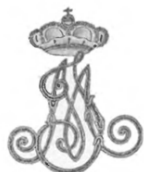
Монограмма Иосифа Максимилиана на Баварскихъ пушкахъ.

Съ 1811 года Наполеонъ сталъ готовиться къ войнѣ съ Россіей, намѣреваясь поднять на нее всѣхъ своихъ вассаловъ и подневольныхъ союзниковъ западной Европы: онъ стремился стать полновластнымъ хозяиномъ во всей Европѣ, но Россія этому мѣшала. Явныя приготовленія Наполеона вынудили и Россію готовиться къ войнѣ. И война эта произошла въ 1812 году. Началь ея Наполеонъ, вторженіемъ въ предѣлы Россіи въ іюнѣ мѣсяцѣ. Война эта была очень тяжела для насъ, но она окончилась совершенною гибелью непріятельскихъ полчищъ. Съ нашей стороны она велась не только арміею, но и народомъ, грудью и имуществомъ вставшимъ за отечество. И война эта получила названіе „Отечественной“. (См. картины №№ 1 и 2 и объясненіе къ нимъ).