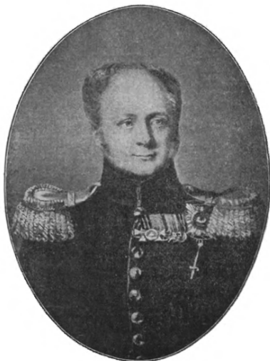
ИМПЕРАТОРЪ АЛЕКСАНДРЪ I БЛАГОСЛОВЕННЫЙ.

Была пора: была святая брань; Отъ Запада узрѣли мы Батыя; Народовъ тьмы прорвали нашу грань; Пришлось поля отстаивать родныя. Дошли къ намъ царскія слова И стала Русь стѣною трона. Была то злая оборона: Дрались за жизнь и за права... Но загорѣлася Москва, И нѣтъ слѣдовъ Наполеона.