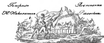
Впередъ, ребята! За Царя и за Отечество! Я и дѣти мои, коихъ приношу въ жертву, откроемъ вамъ путь!

ПОРТРЕТЪ ГЕНЕРАЛА Н. Н. РАЕВСКАГО СЪ ВИНЬЕТКОЙ, ИЛЛЮСТРИРУЮЩЕЙ ЕГО ПОДВИГЪ ВЪ СРАЖЕНІИ ПРИ САЛТАНОВКѢ 11 ІЮЛЯ 1812 ГОДА.