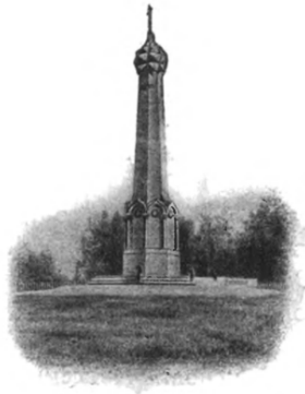
Памятникъ Отечественной войны на полѣ Бородинскаго сраженія.

Въ соотвѣтственныхъ мѣстахъ „Очерка войны“ и пояснительнаго къ картинамъ текста мы сочли полезнымъ привести отрывки изъ произведеній нашихъ поэтовъ-лириковъ, воспѣвшихъ событія и героевъ Отечественной войны (В. А. Жуковскаго, А. С. Пушкина, М. Ю. Лермонтова и другихъ), такъ какъ эти поэтическія творенія оживляютъ рассказъ и ярко живописуютъ героическое прошлое Россіи.