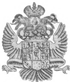
Гербъ на Австрійскихъ пушкахъ.

Начало XIX вѣка въ Европѣ ознаменовалось возникновеніемъ и чрезвычайно быстрымъ распространеніемъ могущества Наполеона. Въ 1804 году онъ провозгласилъ себя императоромъ французомъ и менѣе чѣмъ въ шесть лѣтъ, рядомъ побѣдныхъ войнъ (1805, 1806 — 1807, 1809 годовъ), достигъ власти почти надъ всю западную Европою; многія земли были прямо присоединены къ Франціи въ видѣ новыхъ департаментовъ ея, другія были отданы въ управленіе братьевъ и родственниковъ Наполеона подъ видомъ новыхъ королевствъ (Вестфальское, Неаполитанское, Итальянское...), третьи принуждены были вступить съ нимъ въ принудительно-союзническія отношенія (Австрія, Баварія, Саксонія, Виртембергъ), а Пруссія, разгромленная имъ въ 1806 — 1807 годахъ, должна была отдать Наполеону половину своихъ земель и населенія, принять къ себѣ французскіе гарнизоны и вступить съ нимъ въ унижительный союзъ.