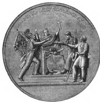
Медаль въ память Отечественной войны.

Задуманное желаніе издателя и составителя: въ дни столѣтней годовщины событій Двѣнадцатаго года дать русскому человѣку краткое и наглядное пособіе, которое удовлетворило бы его потребности оглянуться за 100 лѣтъ назадъ, вспомнить, продумать и прочувствовать великія событія 1812 года. Россія въ 1812 году окончательною побѣдою своею болѣе всего обязана высокому душевному настроенію Царя и его народа. И потомкамъ героевъ Двѣнадцатаго года не иначе, какъ сердцемъ, понять великія событія этого года. Пусть наше художественное изданіе и говоритъ сердцу русскаго человѣка.