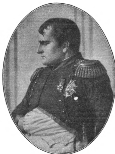
НАПОЛЕОНЪ въ изображеніи В. В. Верещагина.

Прочія картины нашего изданія принадлежатъ кисти художниковъ: А. Д. Кившенко, И. М. Прянишникова, Н. С. Матвѣева, А. Коссака; нѣсколько картинъ написано неизвѣстными художниками. Копіи съ этихъ картинъ воспроизведены нами съ оригиналовъ, находящихся въ Московской Третьяковской галлерей и въ музеяхъ Москвы: Музеѣ 1812 года, Императорскомъ Историческомъ и Шукинскомъ; картины-же Н. С. Матвѣева воспроизведены по спеціальному нашему заказу самому художнику.