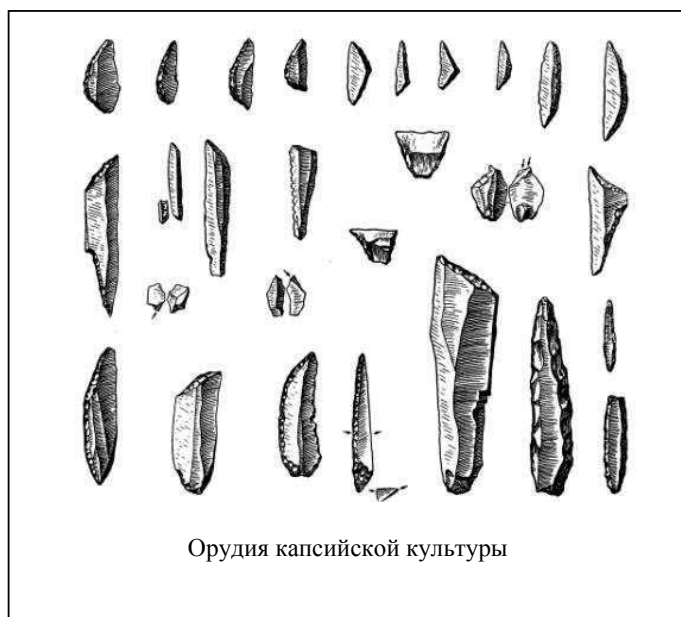
Орудия капсийской культуры

Примерно пять тысяч лет назад начинает меняться климат Сахары, который становится засушливее. В IV тыс. до н.э. на наскальных рисунках исчезают изображения слонов, носорогов и бегемотов. Остаются только страусы, жирафы и антилопы. В это же время появляются изображения быков. Форма рогов у этих быков различна. То это длинные вытянутые вперед рога, то загнутые назад или лирообразной формы. Быки становятся основной темой изображения на наскальных росписях. Количество таких изображений достигает пика примерно к середине IV тыс. до н.э., когда основным занятием населения Сахары было скотоводство.