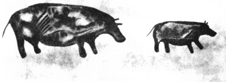
Бегемоты. Фреска из Тассили-Аджера.

Об этом свидетельствуют самые ранние наскальные рисунки, на которых изображены большие африканские животные — слоны, бегемоты, носороги, жирафы. Известное нам африканское животное бегемот не может долго обходиться без воды и жить вне какого-либо водоема. На берег, чтобы