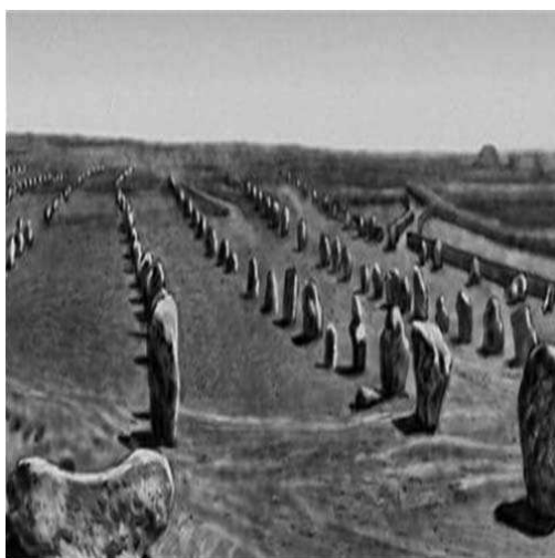
«Аллея камней» в Карнаке. Франция.

Древняя восточная пословица гласит «Все боится времени, но время боится пирамид». Но эта пословицу можно применить не только к пирамидам. То же самое можно сказать о других каменных памятниках древности, но не древнеегипетских, а находящихся в Западной Европе. Причем, некоторые из них даже старше египетских пирамид. Это, например, всем известный Стоунхендж в Британии. Археологические памятники Европы представляют собой чаще всего разбросанные по просторам этого региона каменные сооружения. Одиноко стоящие камни называются менгирами (от валлийского men — камень и hîr — длинный); если это ряд камней стоящих по кругу, то это кромлехи (от бретонского crom — кривой и lech —камень). Сооружение из каменных плит, напоминающих подобие каменного ящика с отверстием в вертикальной стене — это дольмены. Нет никаких сведений о том, представители какого народа являлись строителями данных сооружений, так как письменность в то время просто не существовала. Только в европейских легендах, которые дошли до наших дней, существуют полусказочные персонажи, которым