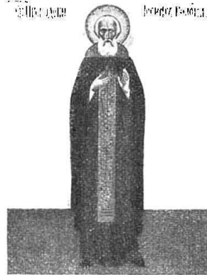
Преп. Іосифъ Волоколаменскій.

Божіемъ. Болѣе полустолѣтія подвизался въ монашествѣ преподобный Давидъ и былъ кормильцемъ-отцемъ всего окрестнаго населенія. 19 сентября 1529 года 1) онъ предалъ Богу свою праведную душу, а честное тѣло его, изнуренное трудами и подвигами, было погребено въ осно-