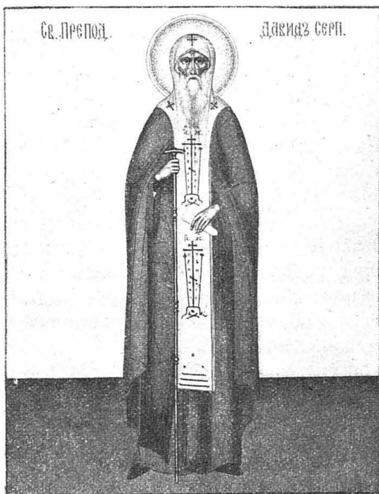
Преп. Давидъ Серпуховской.

Старецъ ударилъ меня по ногамъ жезломъ, велѣлъ идти въ Подольскъ и сталъ невидимъ. Тутъ я, къ вели-