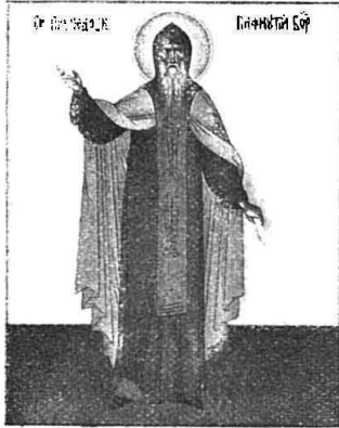
Преп. Пафнутіѣй Боровскій.

своей пустыни преподобный насадилъ липовую рощу. Преподобный Іосифъ 15 августа 1515 года—незадолго до своей кончины—посѣтилъ эту новую обитель, трапезовальсь преп. Давидомъ и братіей и наставлялъ ихъ въ Словѣ