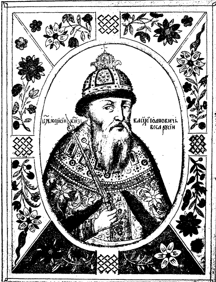
Царь Василій Іоанновичъ Шуйскій. (По Титулярнику).

ство почти до полной гибели. Правительство семибоярщины не отличалось ни силою, ни мужествомъ, ни прозорливостью. Оно было бессильно избрать царя изъ среды русскихъ людей и, опасаясь, что Москву и государство захватить Лжедмитрій II, противо-