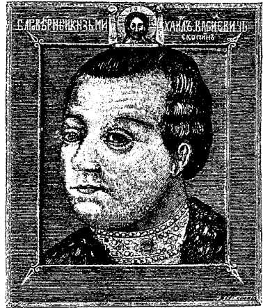
Князь М. В. Скопинъ-Шуйскій. Съ современнаго портрета.

Онъ самъ говорить въ этихъ «Запискахъ», что раньше «онъ посылалъ тайнымъ образомъ въ Москву много писемъ съ универсалами (по-нынѣшнему — прокламаціями, а по-старо-русски — подметными грамотами) для возбужденія ненависти противъ царя Василія, и указывалъ въ нихъ, какъ въ царствѣ Московскомъ въ его правленіе все идетъ дурно и какъ чрезъ него и за него безпрестанно проливалась христіанская кровь; эти универсалы разбрасывали по улицамъ въ Москвѣ. Въ частныхъ же письмахъ, подготавливая заговоръ, онъ давалъ обѣщанія некоторымъ лицамъ и обпадеживалъ ихъ, отчего де умы волювались. Не довольствуясь такою пропагандою, онъ заключалъ съ податливыми на измѣну лицами и прямыя договоры. Его договорная записка съ княземъ Елецкимъ и нѣкоторыя другія бумаги произвели въ Москвѣ такое агитаціонное возбужденіе, что, какъ