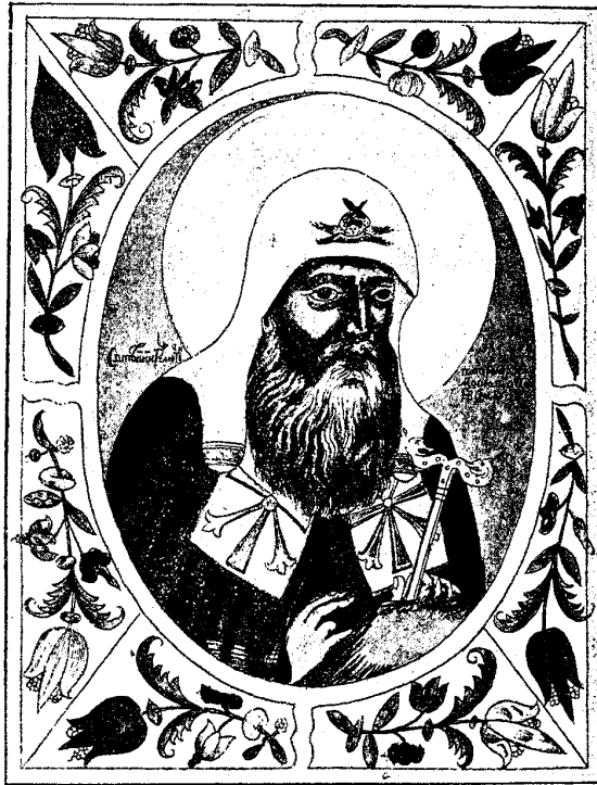
Святѣйшій патріархъ Гермогенъ. Скончался 17 февраля 1612 года.

Червонной и Черной Руси католичили и полячили высшіе классы народа, а низшіе, обращенные въ крѣпостное состояніе, совращали изъ православія въ унию, подвергая жестокимъ притѣсненіямъ самую русскую народность. Ихъ близорукость не смущало и то, что поляки поддерживали и Лжедмитрія I, какъ тайнаго католика, и Лжедмитрія II, какъ орудіе расплаты Россіи, что они еще недавно, подъ предводительствомъ пановъ Сапѣги и