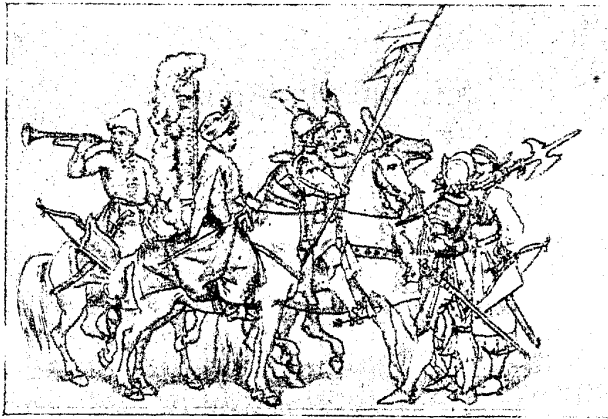
Польское войско XVII вѣка.

Скоро подошли къ Москвѣ поляки, чтобы использовать сдѣланное руками русскихъ измѣнниковъ, смутьяновъ и малодушныхъ. Жолкѣвскій съ своими войсками расположился лагеремъ на Дѣвичьемъ полѣ. Москва, уже заранѣе охваченная иезуит-