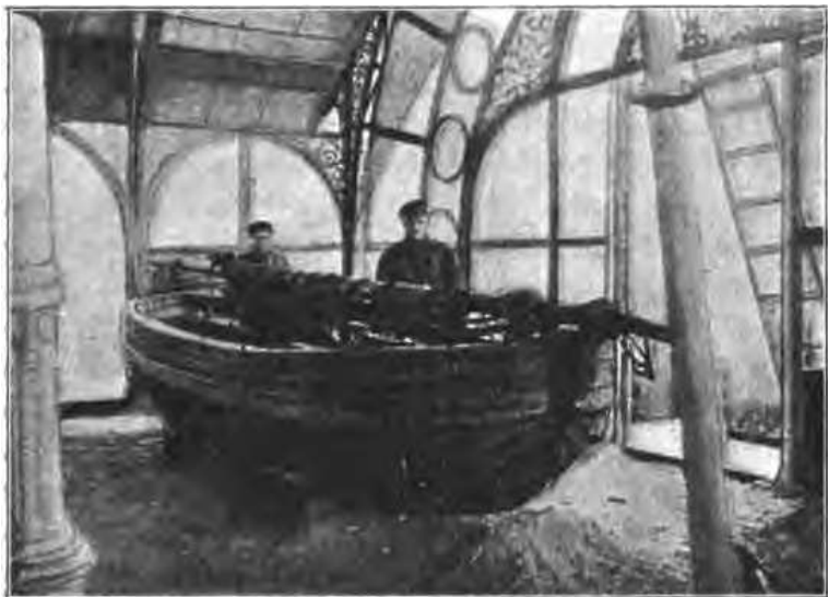
Ботикъ Петра Великаго, хранящійся въ Шлиссельбургѣ.

фельдмаршала Бориса Петровича Шереметева, которому и поручилъ главное начальствованіе надъ войсками въ Ингрии. Но душою и распорядителемъ военныхъ дѣйствій оставался конечно самъ Петръ.