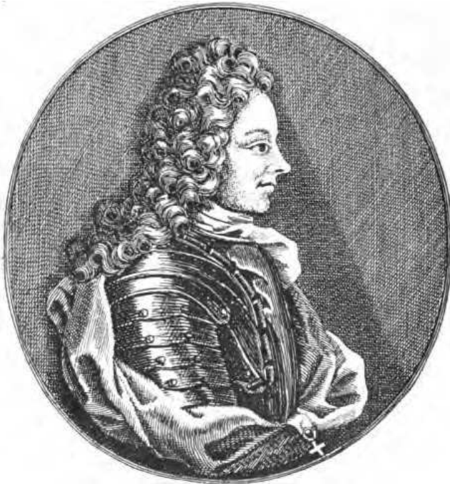
А. Д. Меншиковъ.

и ручной гранатой въ рукахъ, онъ впереди своего отряда первый взошелъ на бортъ 14-пушечнаго судна. Началась кровавая рукопашная схватка. Такъ какъ шведы, по словамъ Петра, „пардонъ зѣло поздно закричали“, то русскіе почти всѣхъ ихъ перекололи; изъ 80 челов. команды на обоихъ