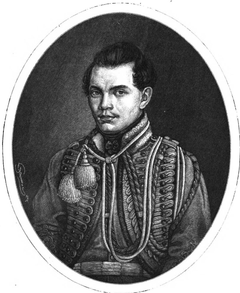
ВИКТОРЪ ГРИГОРЬЕВИЧЪ ТЕПЛЯКОВЪ.

(Род. 15 августа 1804 г. † 2 октября 1842 г.).