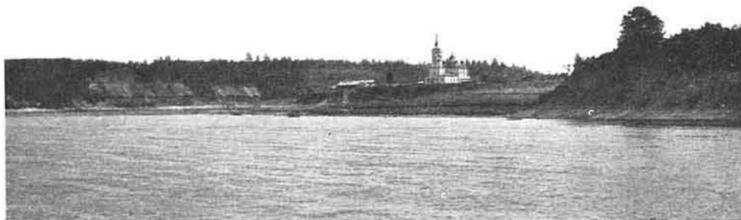
С. Устье-Городищенское на Сухонѣ 110 версть ниже Тотьмы.