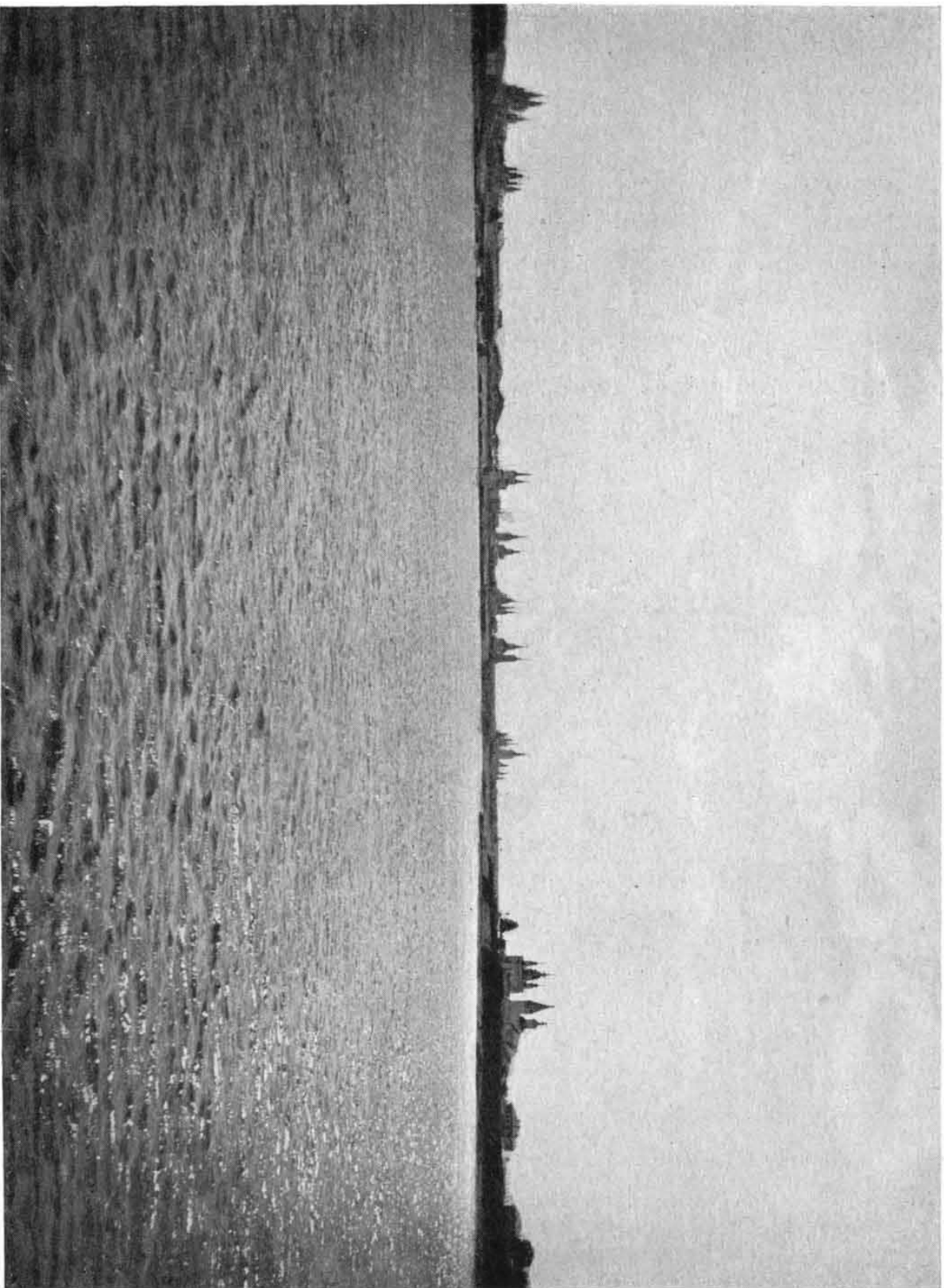
Г. Великий Устюгъ.