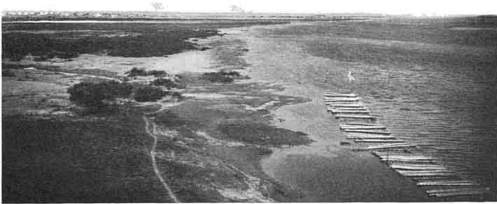
Р. Югъ и впаденіе его въ Двину.

Къ пароходу мы отправились краемъ возвышенности, на которой стоитъ монастырь, и съ гребня обрыва, подмытаго въ ней Югомъ, опять любовались панорамой слиянія Юга и Сухоны и уходящей вдаль Двины. Вѣтеръ, какъ и въ прошломъ году, на этомъ мысу такъ силенъ, что