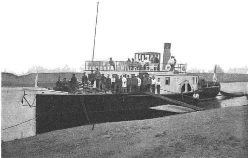
Казенный пароходъ „Самофидъ“.

какъ обыкновенно бываетъ у насъ послѣ грозъ, температура сразу упала и поднялся сильный вѣтеръ. При такой погодѣ мы и отправились поздно вечеромъ, напутствуемые добрыми пожеланіями прово-