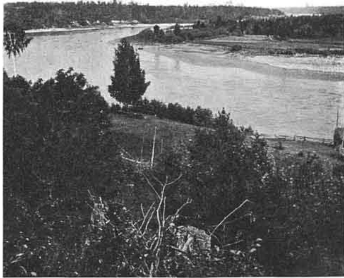
Сухона у д. Осетры.

долженъ былъ остановиться, далеко еще не доѣхавъ до него; Югъ оказался очень мелководнымъ и мы даже къ берегу близко подойти не могли, такъ что пришлось добратъся до луга на лодкѣ и пройти до монастыря съ версту пѣшкомъ. Ничего въ немъ не измѣнилось съ нашей прошлогодней поѣздки; также стоитъ онъ, заброшенный и пустой, также навѣваетъ грусть его унылый видъ, напоминающій о мирно текшей здѣсь когда-то жизни; шумятъ своими верхушками кедры, остатки старины, и словно рассказываютъ заброшеннымъ сюда путникамъ о быломъ, а кругомъ все живетъ и радуется: стало совсѣмъ тепло, пѣсни жаворонковъ льются съ высоты голубого неба, высокая трава волнуется, вдали бѣлѣетъ своими церквами красивый, залитой солнцемъ Устюгъ.