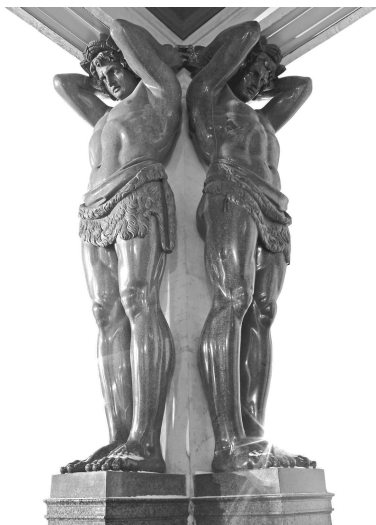
■ Знаменитые атланты Эрмитажа

История Зимнего дворца чрезвычайно богата. Если у вас будет возможность послушать о ней из уст гида, то обязательно воспользуйтесь ей. Пожары и перевороты, расширения и переустройства, смена цвета и декора — настоящий сериал длинной в несколько веков.