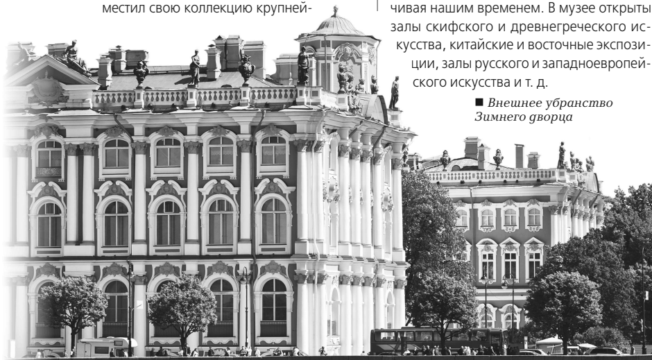
■ Внешнее убранство Зимнего дворца

После революции работа была продолжена, и фонды музея пополнились национализированными частными коллекциями, а также работами современных художников и скульпторов. Сейчас в Эрмитаже собраны шедевры самых разных эпох, начиная с каменного века и заканчивая нашим временем. В музее открыты залы скифского и древнегреческого искусства, китайские и восточные экспозиции, залы русского и западноевропейского искусства и т. д.