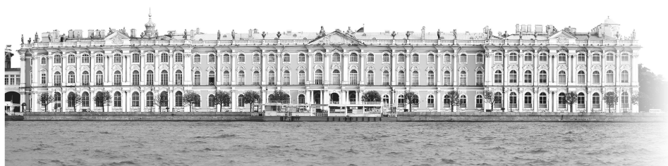
■ Величественная панорама Зимнего дворца открывается со стороны Невы

Существующий же сегодня Зимний дворец — пятая версия, появившаяся в 1762 году. Это здание по праву можно назвать символом елизаветинского барокко — одного из самых изысканных и помпезных архитектурных стилей. После Б. Ф. Растрелли над его образом работали такие великие мастера, как Ю. М. Фельтен, С. И. Чевакинский, Ж.-Б. Валлен-Деламот и А. Ринальди. Дворец действительно стал огромным и насчитывает уже более 1500 помещений. Внутренняя и внешняя отделки дворца поражают роскошью и великолепием. Это действительно настоящий шедевр, достойный самых восторженных эпитетов.