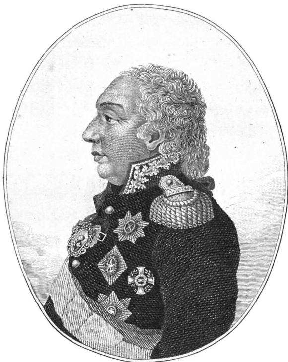
Князь Михаилъ Павловичъ ГОЛЕНИЩЕВЪ - КУТУЗОВЪ СМОЛЕНСКІЙ.