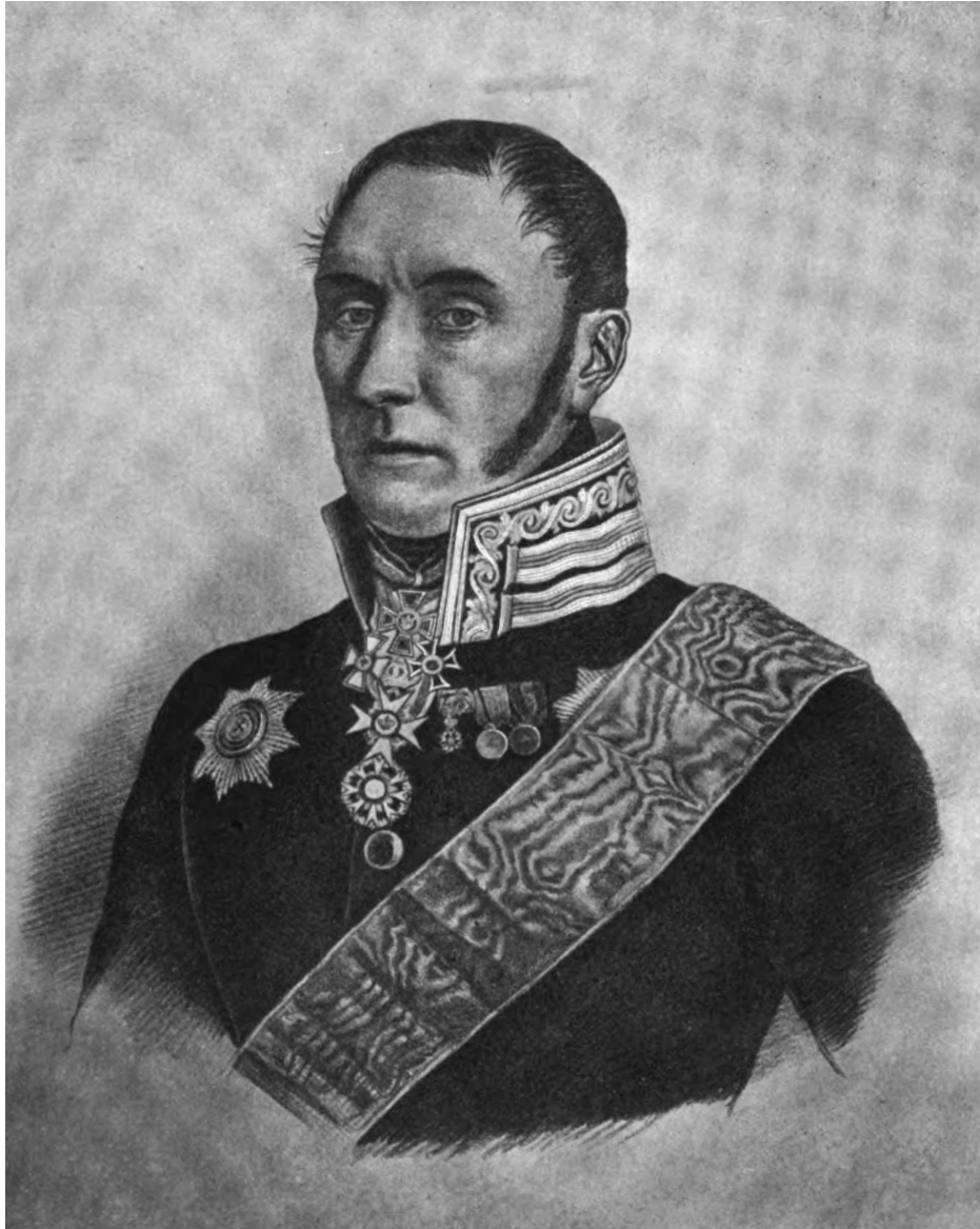
Президентъ Мед.-Хир. Академіи Лейбъ-Хирургъ баронетъ Я. В. ВИЛЛЕ.