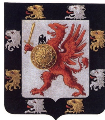
Герб рода Романовых