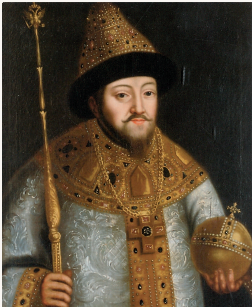
Неизвестный художник. Портрет Михаила Федоровича

Личность основателя династии Романовых, царя Михаила Федоровича, значительно уступает по яркости как отцу, патриарху Филарету, так и сыну, царю Алексею Михайловичу. Государь-юноша, взойшедший на престол на исходе кровавой Смуты, Михаил Федорович был и остается загадкой для историков. Он не отличался выдающимися достоинствами, которые могли бы привлечь к нему выбор в 1613 г. Не ясно и то, как тихий, богомольный царь сумел успокоить бушевавшую вражду и вернуть страну к мирной жизни. Царь Михаил Федорович правил чуть более 30 лет