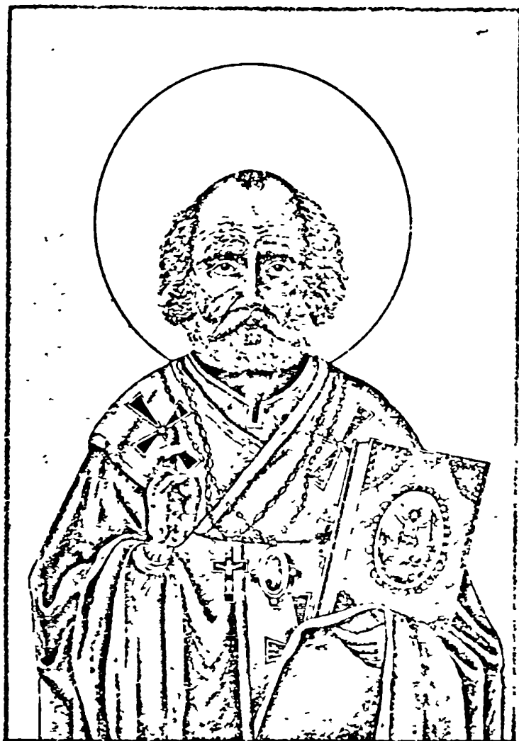
Святитель Николай Чудотворецъ (стр. 23).