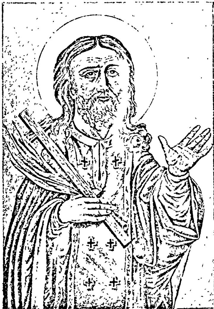
Свящ.-муч. Іоаннъ Кумша (стр. 10).