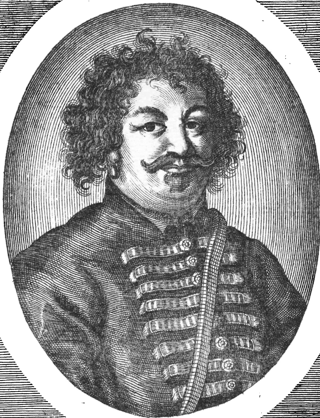
STEPHANVS RAZINVS, PERDVELLIS MOSCOVICVS.