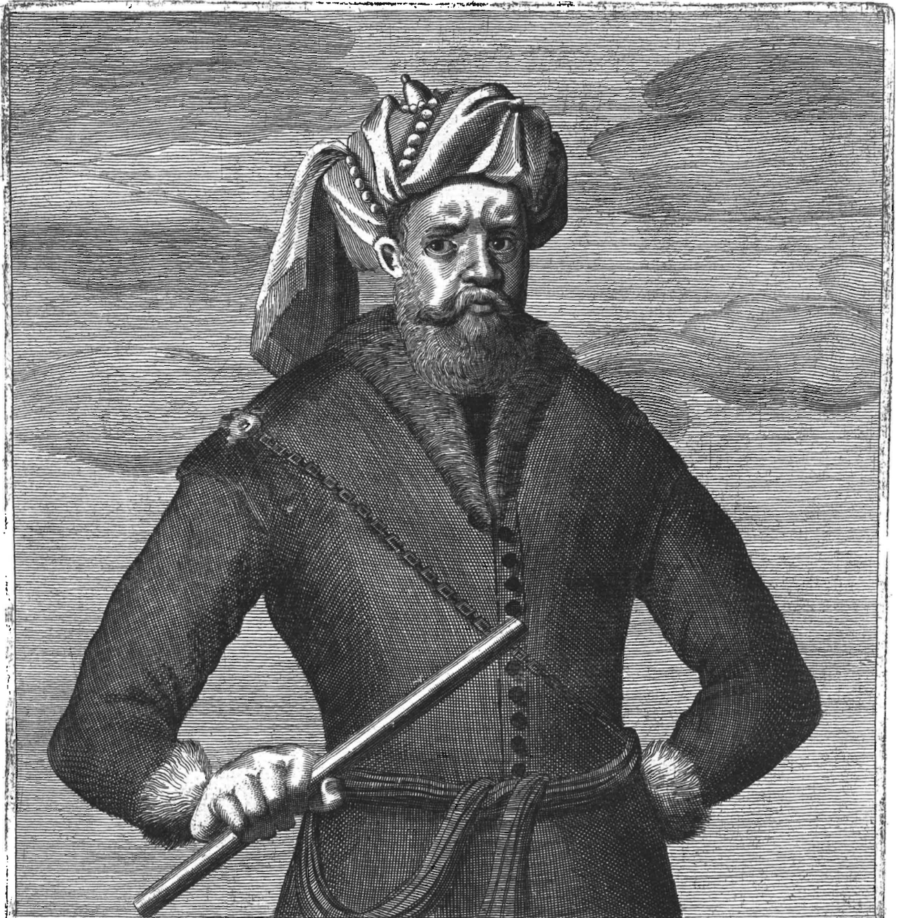
Wahre Abbildung SEINER MAJESTÄT KAISERS Haupt-Nebellens in Moskoven Welche seinen gebrüchlichen Bruder zu rächen mit zusammenrottung etlicher Häuffen Erstlich einen Rauber gespielet folgend durch auffrichtung einer Armee küniglichen Obersten erwachsen Die reiche Handel Stadt Astracan samt vielen andern Orten eingenommen Die Armaden des grossen kaisers etliche mahl auß dem selbe geschlagen durch an sich ziehung vieler fürnehmen Mus; vermögten Ihn selbst in solche Gefahr gesetzt das Ihm die Krone wa ckelt und also diesen Potentaten der vorhin nach fremden Kronen so blutig gestrebt seiner eigenen verunsichert hat Rauler Fürst B.