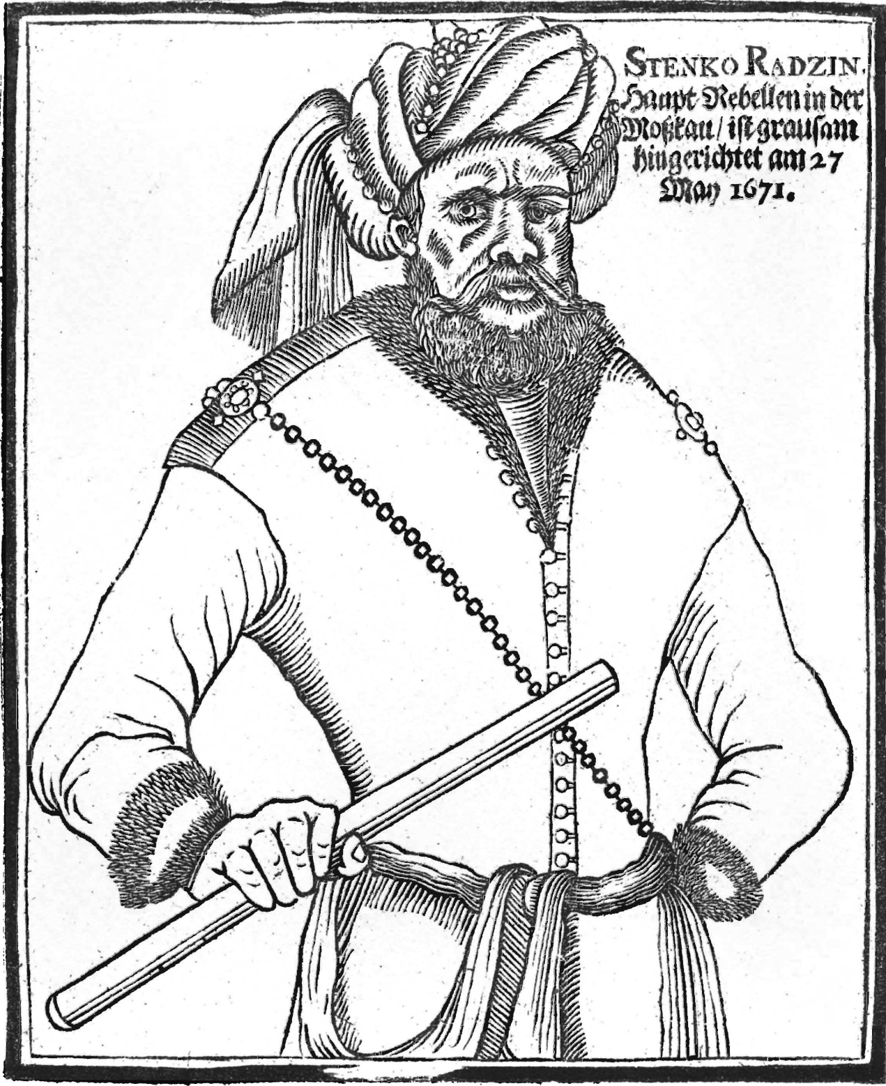
STENKO RADZIN. Haupt Rebellen in der Moskau / ist grausam hingerichtet am 27 May 1671.