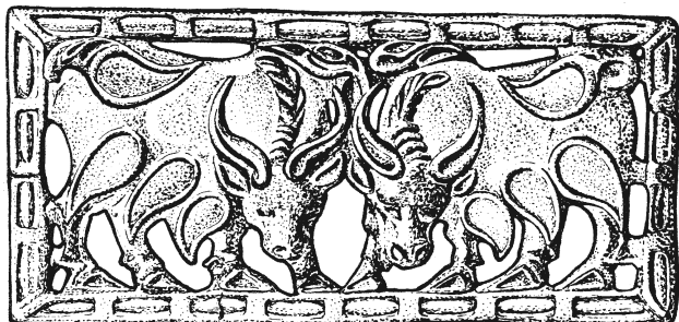
Рис. 2. Бронзовая пластинка с изображением двух быков. Обнаружена на северо-востоке Китая. Это свидетельствует о культурных связях между ханьским Китаем и другими странами

лялась основным сырьем для производства текстильных изделий, позже им становится хлопок. Примерно с 1000 года до н. э. крестьяне начали культивировать тутовые деревья, на которых шелковичные черви «пряли» свои нити для изготовления роскошных одеяний.