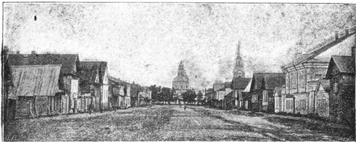
Миллионная улица въ гор. Осташковѣ.

Городъ красиво расположился во всю длину полуострова, касаясь своей южной стороной материка. Главная улица,—