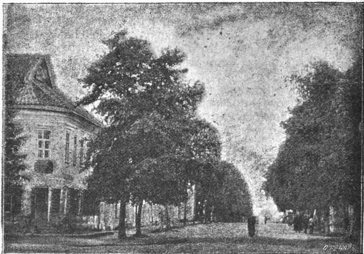
Видъ бульвара въ гор. Осташковѣ.

Почти перпендикулярно къ направленію, по которому растянулся городъ, вблизи базара, раскинутъ роскошный