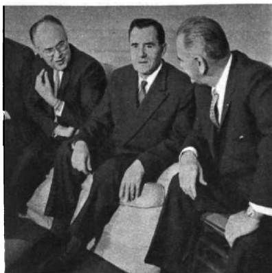
В Нью-Йорке заседают XIX сессия Генеральной Ассамблеи ООН. В ее работе принимает участие делегация СССР во главе с министром иностранных дел А. А. Громыко. В Вашингтоне А. А. Громыко встретился с президентом США Л. Джонсоном. В беседе принимал участие посол СССР в Соединенных Штатах А. Ф. Добрынин. Состоялся обмен мнениями по ряду вопросов, в которых заинтересованы Советский Союз и США.