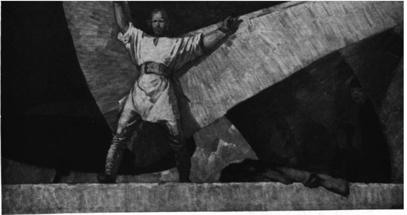
ХУДОЖЕСТВЕННАЯ ВЫСТАВКА «МОСКВА — СТОЛИЦА НАШЕЙ РОДИНЫ»