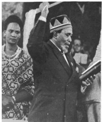
В первую годовщину своей независимости Кения стала республикой. Этим шагом молодое африканское государство укрепило свое самостоятельное положение в мире. Лидер Кении Джомо Кенята, много лет возглавлявший освободительную борьбу своего народа, принял присягу, вступив на пост президента республики. Великобритания, бывший колониальный хозяин Кении, вывела из страны все свои войска. Англичанин Малкольм Макдональд, занимавший пост генерал-губернатора Кении, попрощался в аэропорту Найроби с теми, кто провожал его, и отбыл восвояси — навсегда.