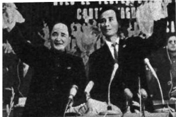
В президиуме конференции. Руководители делегаций Демократической Республики Вьетнам и Южного Вьетнама отвечают на приветствия зала.