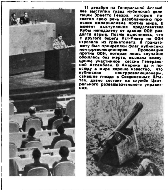
11 денября на Генеральной Ассамблее выступил глава кубинской делегации Эрнесто Гевара, который провозгласил свою речь разоблачению провисов империализма против мира. В момент выступления представителя Кубы неподалеку от здания ООН раздался взрыв. Позже выяснилось, что с другого берега Ист-Ривер по ООН стреляли из гранатомета. К гранатомету был прикреплен флаг кубинских контрреволюционеров. Провокация против ООН, которая лишь случайно обошлась без жертв, вызвала возмущение участников сессии Генеральной Ассамблеи. В Америке да и по-исуду в мире хорошо известно, что кубинские контрреволюционеры, свившие гнездо в Соединенных Штатах, давно состоят на службе Центрального разведывательного управления.