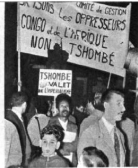
Имя Чомбе, предателя конголезского народа, вызывает ненависть Африки. В Алжире состоялась манифестация против политики колонизаторов в Конго и против их лакей. В европейских столицах, которые посетил Чомбе во время последнего вояжа, тоже прошли демонстрации с требованиями не оказывать гостеприимства убийце.