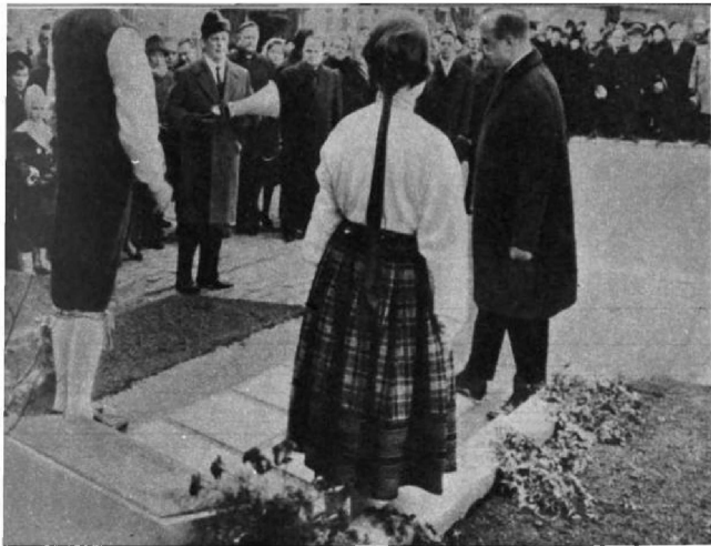
Городские власти Турку (Финляндия) установили мемориальную доску в память о пребывании в городе Владимира Ильича Ленина в 1907 году. Снимок запечатлел момент торжественного открытия мемориальной доски.