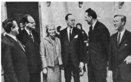
Среди лауреатов Нобелевской премии этого года два советских ученых-физика — Николай Васов и Александр Прохоров. Этот снимок сделан в Стокгольме, где были вручены премии. Слева направо: Теодор Линен из Мюнхена, удостоенный звания лауреата за работы в области медицины, Николай Васов, английский химик из Оксфорда Дороти Кроуфут-Ходжинс, американский физик Чарльз Таунс, Александр Прохоров, американский медик Конрад Блох.