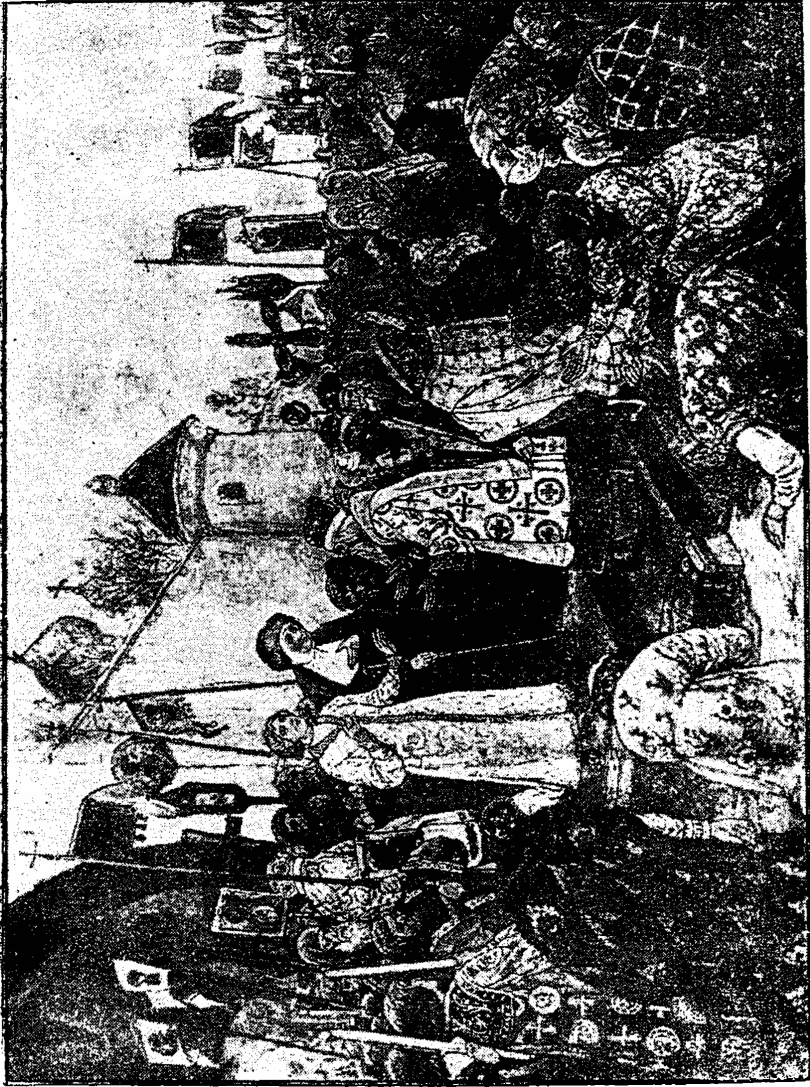
Приваніе на царство Михаїла Феодоровича Романова.