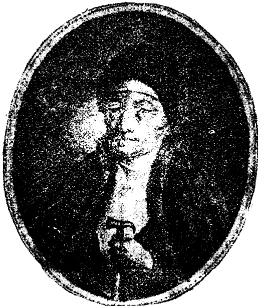
Иноккини Марѳа, мать Царя Михаила Теодоровича Романова.

Много труда предстояло новоизбранному Царю Михаилу Теодоровичу по устроению Россійскаго Государства. Снова, какъ встарь, можно было сказать про Русскую землю, что она велика и обильна, да порядка въ ней нѣтъ. Много богатствъ было въ нѣдрахъ Русской земли, много силы въ русскомъ народѣ; но нужно было этой силѣ просторъ дать, надо было эту силу на доброе дѣло направить.