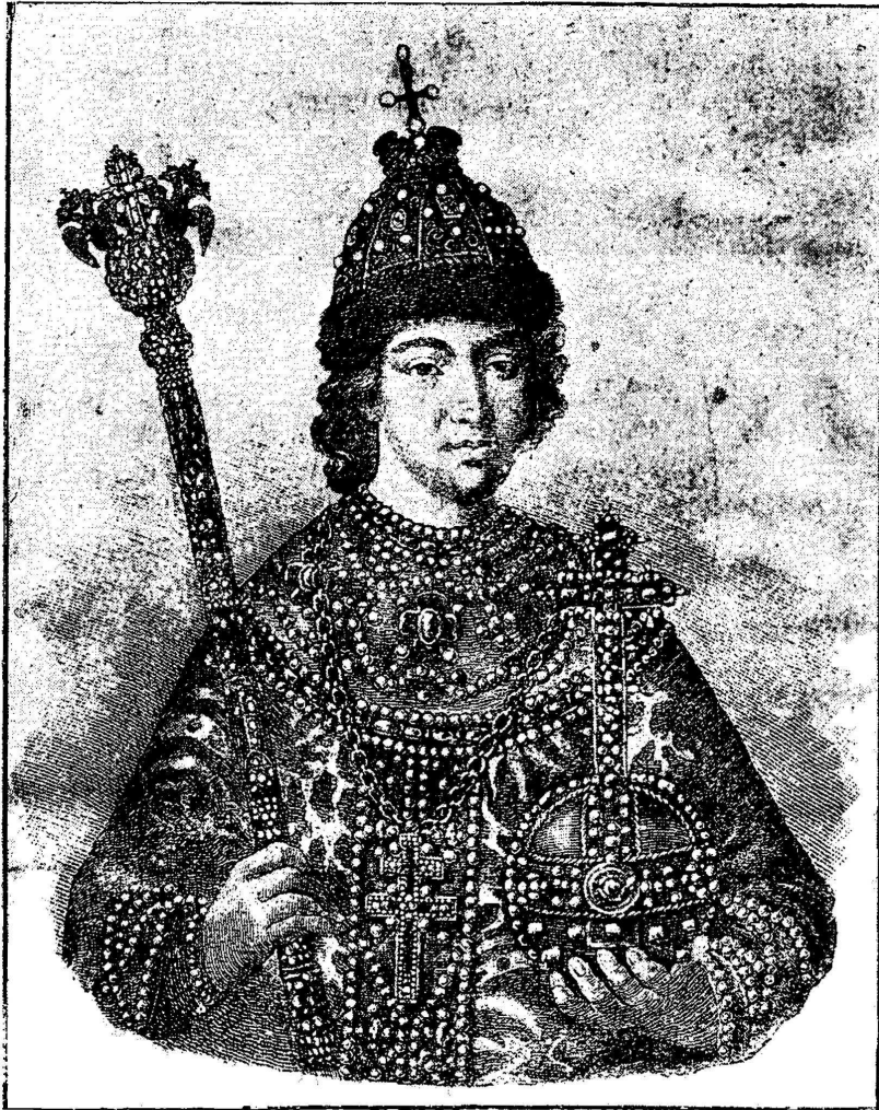
Первый Царь изъ Дома Романовыхъ Михаилъ Феодоровичъ.