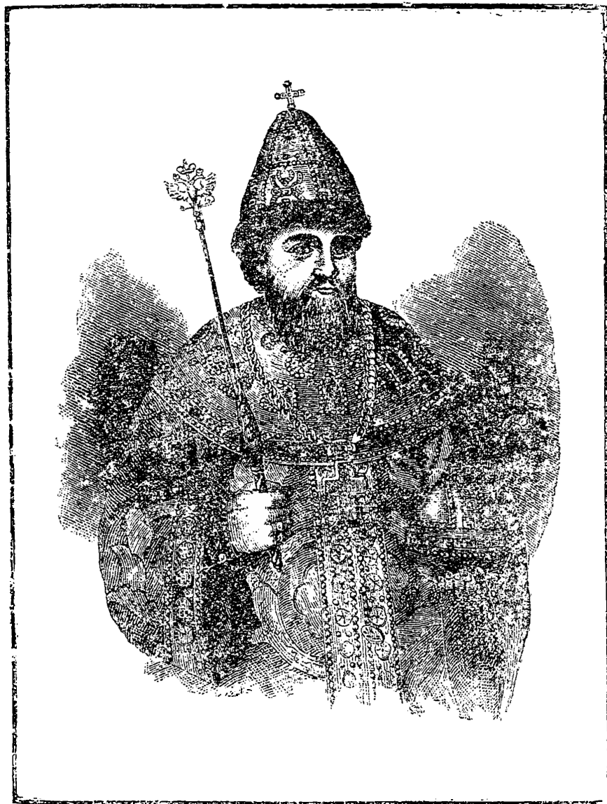
Царь Алексѣй Михайловичъ.

приказы воеводамъ, воеводы старостамъ, а тѣ передавали повелѣнія народу и слѣдили, чтобы повелѣнія исполня-