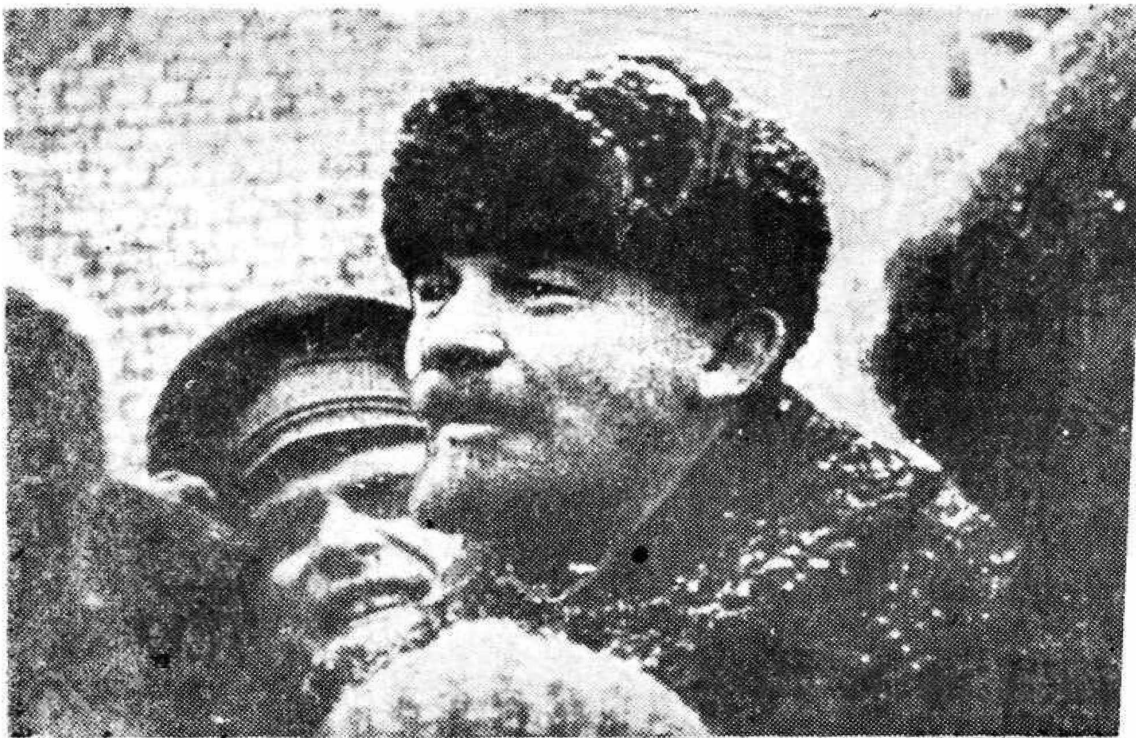
В. И. Ленин на Красной площади 7 ноября 1919 года.

Ленин... Образ его навсегда сохранится в сердцах людей. в памяти поколений.