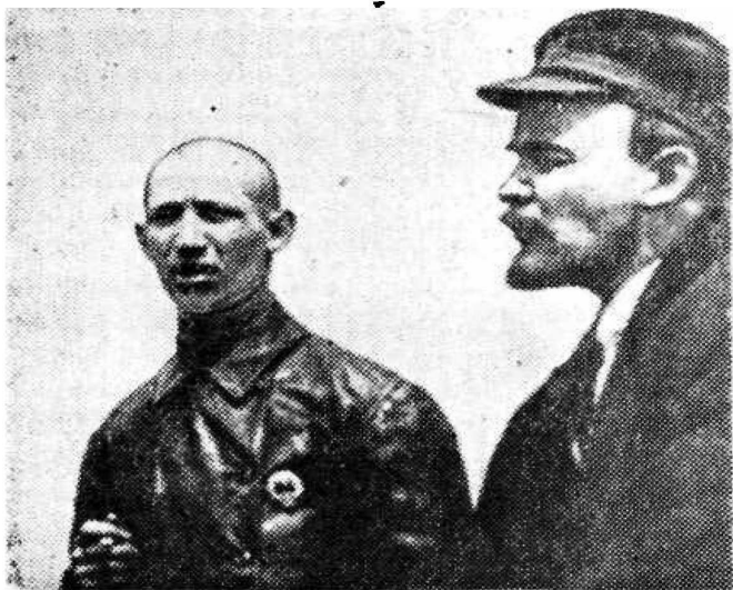
В. И. Ленин на параде в субботу.

ленькой, просто обставленной квартире, которая находилась недалеко от кабинета Ленина.