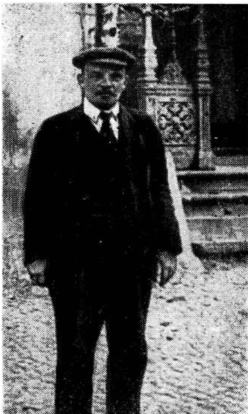
И. Ленин. Кремль, 1918.