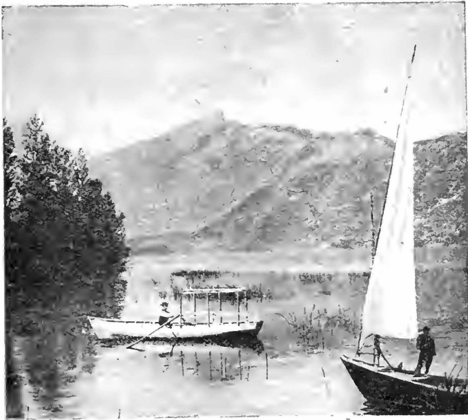
Озеро въ Буржэ