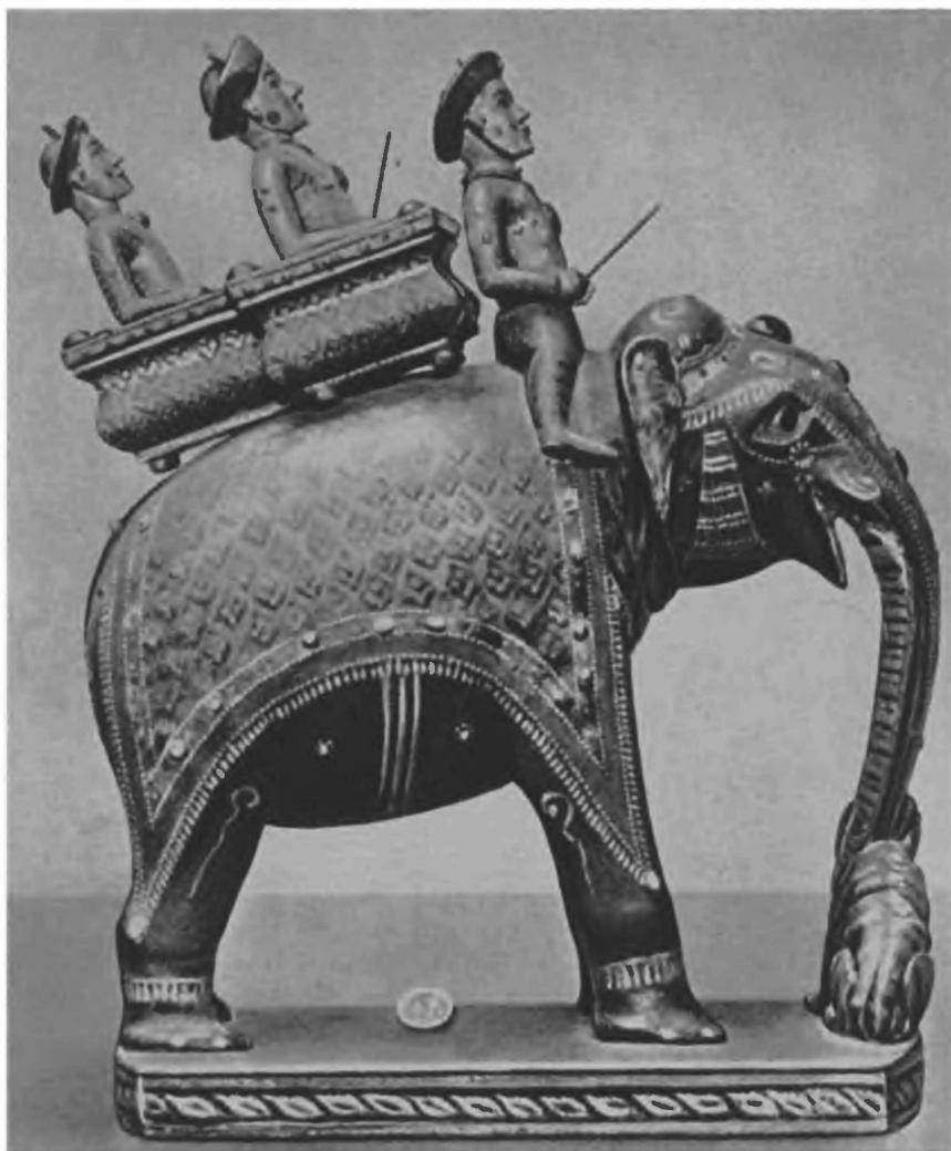
Малайская фигура шахматного короля (XVII век), вырезанная из дерева, покрытая разноцветным лаком, а также инкрустированная драгоценными и полудрагоценными камнями.

писал: „Нет никаких сомнений в том, что шахматы не были изобретены одним человеком, а являются результатом коллективного, народного творчества“.