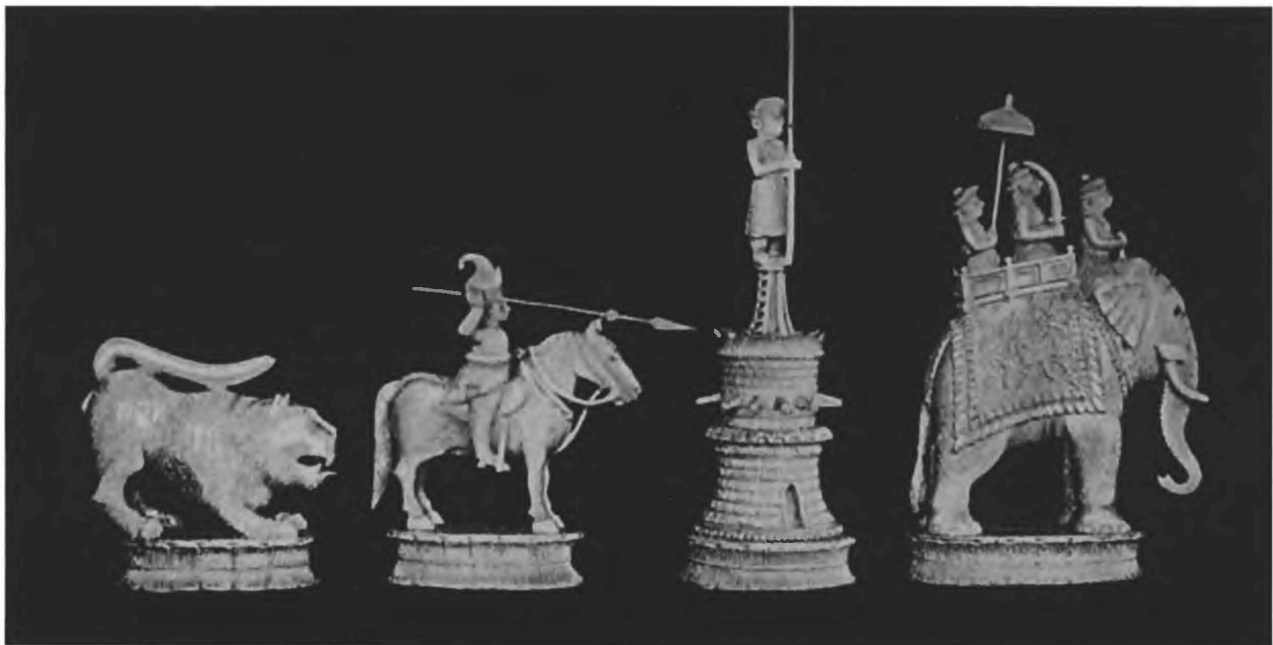
Шахматные фигуры из слоновой кости, сделанные в XVIII веке в Индии по образцу древнеиндийских фигур.

время осады Трои. Видимо, эта игра не поправилась грекам, так как они никогда больше не играли в нее, и лишь много столетий спустя арабы для потомков Паламеда были вынуждены восстанавливать правила шахматной игры.