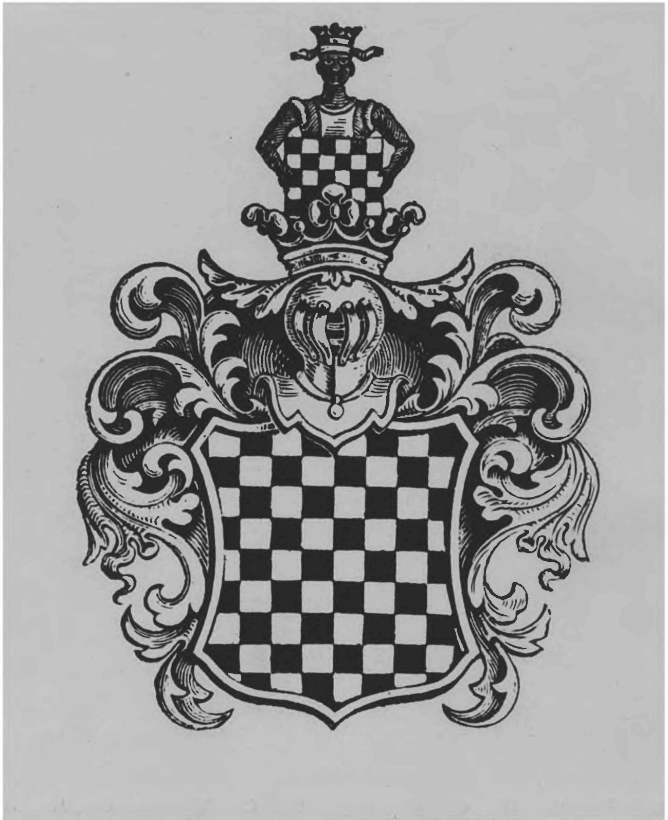
Польский герб Вчеле, восходящий ко временам правления короля Болеслава Кривоустого (XII век). В его рисунке — две шахматные доски, а его происхождение, согласно легенде, связано с шахматной игрой.