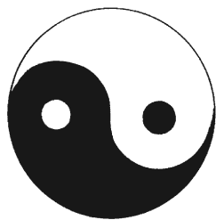
Символ Тай Цзи

Инь и ян в китайской философии и космогонии — это две первоосновы мироздания, две непознаваемые космические силы, находящиеся в постоянной борьбе, содержащие в себе частицу друг друга, но не переходящие при этом одна в другую. Обычно противостояние сил инь и ян изображают с помощью символа Тай Цзи («великий предел»).