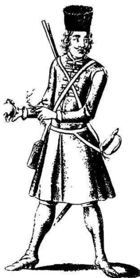
Гренадеръ XVII стол. съ лит. по рис. того врем.

Съ введеніемъ гренадерскихъ ротъ постепенно увеличиваются требованія, предъявляемыя гренадерамъ, и метаніе гранатъ вводится не только при осадной войнѣ, но и въ открытомъ полѣ. Постепенно является стремленіе назначать гренадеръ на болѣе отвѣтственныя мѣста, — въ голову штурмующихъ колоннъ, на усиленіе фланговъ боевого порядка и для дѣйствія противъ кавалеріи. Вообще начало XVIII столѣтія является самой блестящей эпохой въ исторіи гренадеръ, какъ пѣхоты, имѣющей особое специальное назначеніе. Но съ теченіемъ времени увлеченіе это, вслѣдствіе развитія огнестрѣльнаго оружія, начинаетъ падать и гренадеры постепенно превращаются во всѣхъ арміяхъ въ родъ войскъ, который только по своему составу является отборнымъ, не отличаясь въ своемъ вооруженіи отъ остальной пѣхоты. Во второй половинѣ XVIII столѣтія гренадеры уже употребляются, какъ и прочая пѣхота, но назначаются исключительно въ тѣ мѣста, гдѣ требовался отборный составъ людей, чтобы придать боевому порядку особую стойкость 1) .