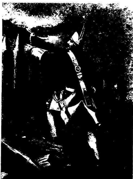
Гренадеръ 1700 г.

веты Петровны, Петровскія начала снова вернулись въ русскую армію и гренадеры, будучи выдѣлены изъ состава ротъ, составили въ каждомъ пѣхотномъ и драгунскомъ полку отдѣльную роту. Затѣмъ, въ 1753 году, къ составу пѣхотныхъ полковъ было прибавлено еще двѣ гренадерскихъ роты и всѣмъ полкамъ было повелѣно состоять въ трехъ баталіонномъ составѣ съ тремя гренадерскими ротами, по 200 гренадеръ въ каждой 1) ).