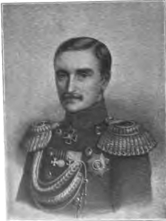
Генералъ адмиралъ Владимиръ Александровичъ Корниловъ.

Россію большими побѣдами. 19 Ноября войска наши на Кавказѣ наголову разбили большой турецкій отрядъ при Башъ-Кадыкларь , а днемъ раньше, 18-го числа, нашъ черноморскій флотъ истребилъ турецкую эскадру близъ Синопа .