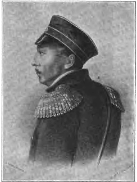
Вице-адмиралъ Павель Степановичъ Нахимовъ.

Несмотря на сильный огонь, которымъ встрѣтили насъ турецкая эскадра съ фронта и береговья батареи съ фланга, наши