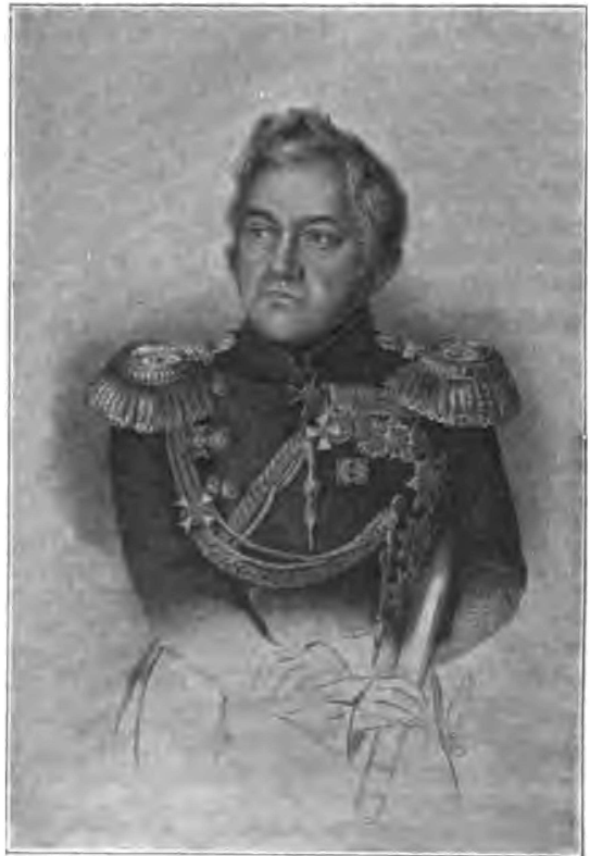
Адмиралъ Михаилъ Петровичъ Лазаревъ.

Главные военныя дѣйствія происходили на окраинѣ Государства, на Крымскомъ полуостровѣ, гдѣ у насъ было мало войскъ, такъ какъ большое число ихъ надо было держать на западѣ, откуда грозила Австрія. Да и это небольшое количество войскъ въ Крыму было отдѣлено отъ остальной Россіи степнымъ пространствомъ въ нѣсколько сотъ верстъ, на которомъ не было не только желѣзныхъ, но даже и шоссейныхъ дорогъ. Все нужное нашимъ войскамъ надо было подвозить издалека, по плоскимъ грунтовымъ дорогамъ, на истощенныхъ волахъ и лошадяхъ на многія сотни верстъ, тогда какъ враги наши пользовались моремъ и легко подвозили все, что имъ нужно, на быстрыхъ паровыхъ судахъ. Къ тому же, имѣя больше денегъ, непріятели наши успѣли перевооружить свои арміи отличными ружьями, чего у насъ не было.