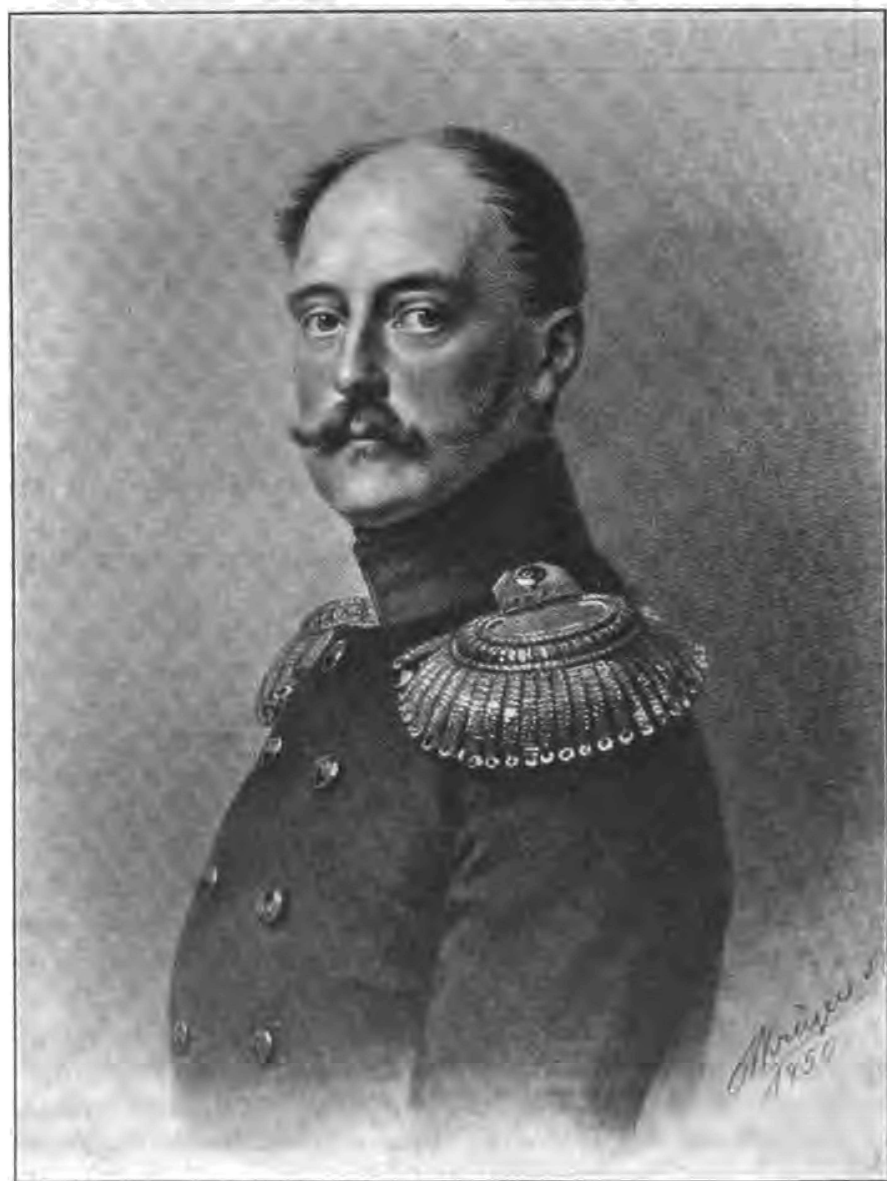
Императоръ Николай I.