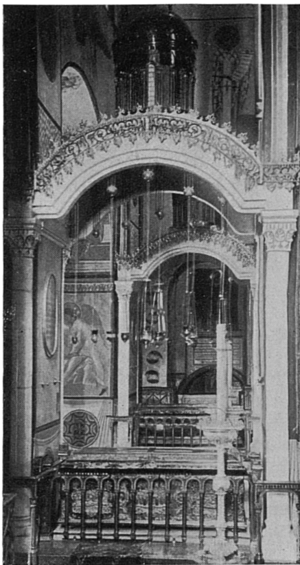
Рака съ мощами Андрея Боголюбскаго.

Въ настоящее время въ соборѣ пять престоловъ: первый главный, въ честь Успенія Божіей Матери, 2-й придѣльный на сѣверной сторонѣ (на лѣво отъ главнаго) во имя св. Бл. Вел. Князя Андрея Боголюбскаго, 3-й на южной сторонѣ (направо отъ главнаго) во имя св. Бл. Князя Глѣба, сына Андрея Боголюбскаго, и кромѣ этого въ пристроенной къ древнему собору галлерей