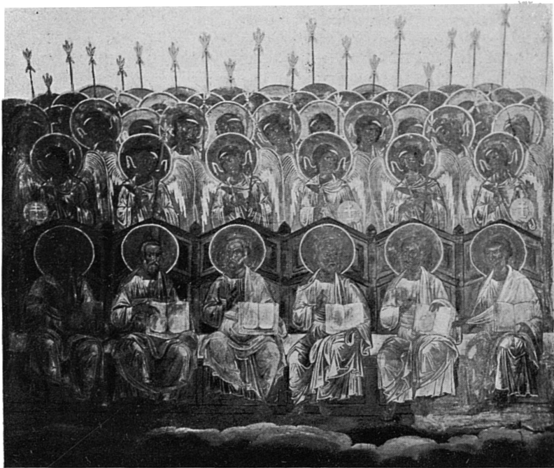
Страшный судъ. Фреска XV в.

много, что въ большіе праздники этими пеленами увѣшивался весь путь («въ двѣ верви чудныхъ») отъ собора до Золотыхъ воротъ и до епископскаго дома. Предъ царскими воротами былъ устроенъ «отъ злата и серебра» прекрасный амвонъ въ видѣ небольшой овальной формы часовни. Но драгоцѣннѣе всѣхъ украшеній и сокровищъ храма была поставленная въ немъ чудотворная икона Богоматери, писанная, по преданію, св. евангелистомъ Лукою и принесенная сюда А. Боголюбскимъ изъ Вышгорода.