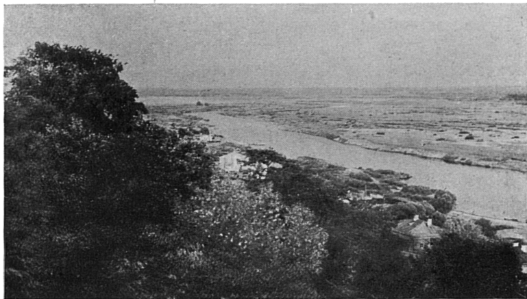
Рѣка Клязьма около г. Владиміра.

Возвышенію города также способствовало и перенесеніе сюда мощей муч. Авраамія изъ земли Камскихъ Болгаръ въ церковь женскаго княгинина монастыря. Но при томъ же Юріи послѣдовалъ татарскій разгромъ (въ февралѣ 1238 г.) при которомъ зданія города сильно потерпѣли, въ томъ числѣ и Успенскій соборъ. Съ этого времени Владиміръ постепенно утрачиваетъ свое первенствующее значеніе на сѣв.-в. Руси. Правда, митр. Максимъ въ 1299 г. переноситъ сюда изъ Кіева митро-