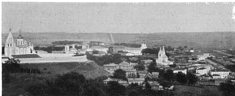
Видъ г. Владиміра съ южной стороны.

Значеніе города возрасло послѣ смерти Боголюбскаго, при братѣ его Вел. Кн. Всеволодѣ III Юрьевичѣ, Большое Гнѣздо. Во все почти продолженіе княженія Всеволода Владиміръ наслаждался полнымъ спокой-