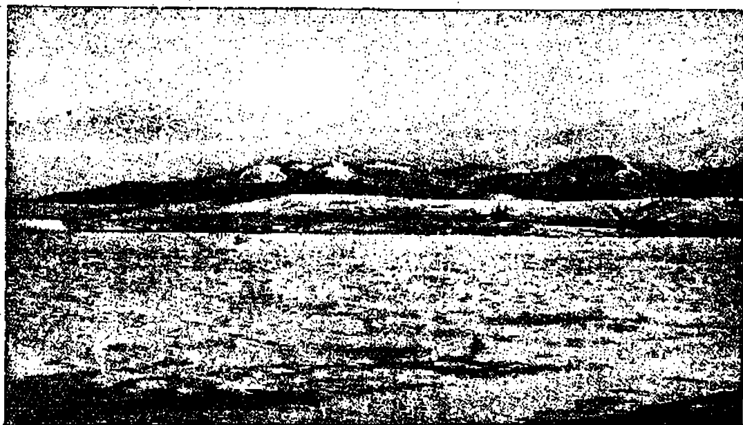
Портъ Александровскій зимой.

Съ другой стороны, не остается безъ нѣкотораго вліянія и со-сѣдство моря. Въ результатѣ получается очень неурядное для Саха-лина стеченіе обстоятельствъ. Климатъ его отличается суровой, чисто континентальной, зимой и холоднымъ лѣтомъ приморскихъ странъ. Хотя сѣверный конецъ острова приходится, приблизительно, на одной широтѣ съ Симбирскомъ, но зимы въ этой части Сахалина по суро-вости не уступаютъ зимамъ устья р. Печоры, лежащаго выше по-лярнаго круга. Морозы ниже точки замерзанія ртути здѣсь обыкно-венное явленіе, а лѣто не теплѣе, нежели на Соловецкихъ островахъ и въ Бѣломъ озерѣ. Въ средней части острова, на широтѣ Саратова или Воронежа, лѣто настолько холодно, что еще въ іюлѣ случаются морозныя ночи, и до самой осени на глубинѣ 2—3 аршинъ почва остается промерзшей.