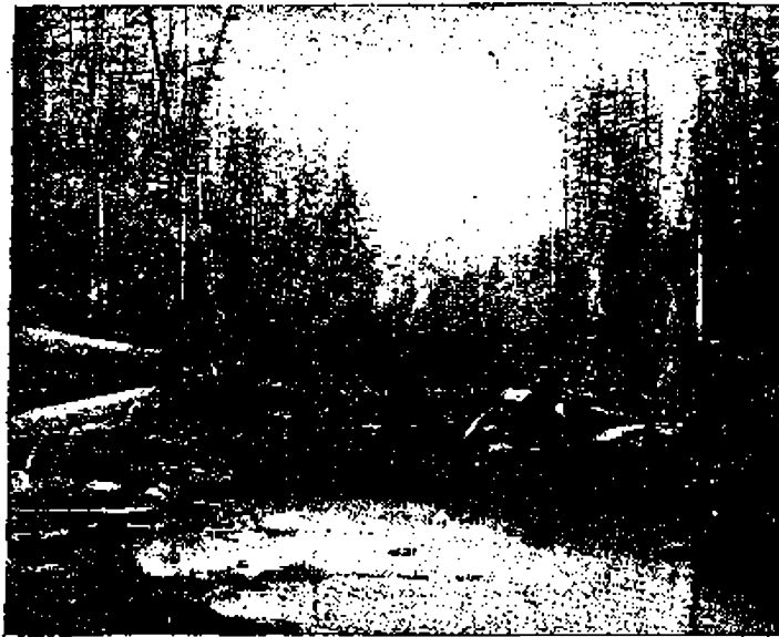
Дорога на Сахалинѣ.

Если въ Сибири тайга трудно проходима, то на Сахалинѣ она непролазна; если тамонній лѣсъ состоитъ изъ огромныхъ деревьевъ, то здѣсь они имѣютъ исполинскіе размѣры. Вы можете бродить по ней цѣлый день, хотя бы цѣлую недѣлю и больше: передъ вами всюду гигантскіе стволы вѣковыхъ елей и пихтъ, а надъ головой темная зелень хвой, сквозь которую не пробивается ни единый лучъ солнца. Нѣтъ здѣсь ни цвѣтовъ, ни кустовъ, нѣтъ даже травы: вмѣсто нихъ, въ промежуткахъ между деревьями, вы видите груды наломан-