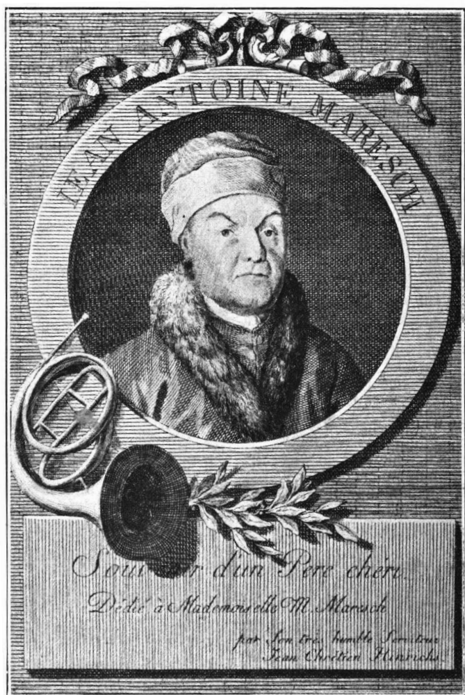
Юганъ Марешъ. (1719—1789).