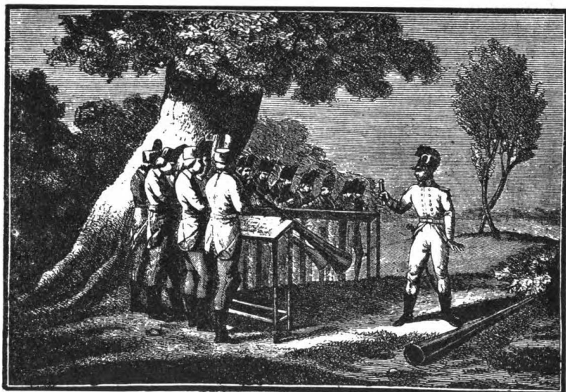
Роговой оркестръ въ царствованіи Имп. Павла I (1796—1802).