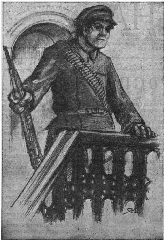
Возвонанный, он забрался на крыльцо Охотнойрядской часовни, чтобы оттуда подальше видеть...

...АКИМКА, сдвинув шапку на затылок, шел смело, с самым решительным видом. Когда проезжали автомобили с солдатами, он кричал „ура“, срывал с головы свою обгрепленную шапку и отчаянно ее махал. Туго подпоясанный ремнем, подтянутый, взволнованный, он будто шлеп в толпе: так легко ему было идти.