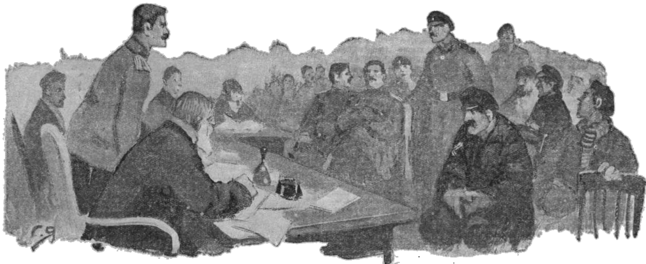
Заседание исполнительного комитета было исключительно бурным...

Всегда обычная и совсем не страшная слободка стала сегодня таинственным гнездом грядущих восстаний. Чуть-