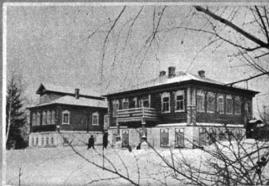
Санаторий для колхозников артели имени К. Тимирязева.