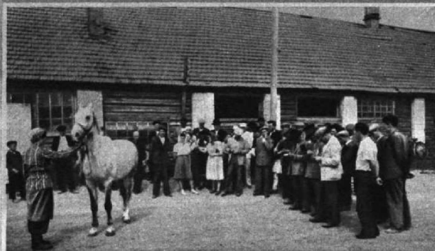
Румынская делегация в колхозе.