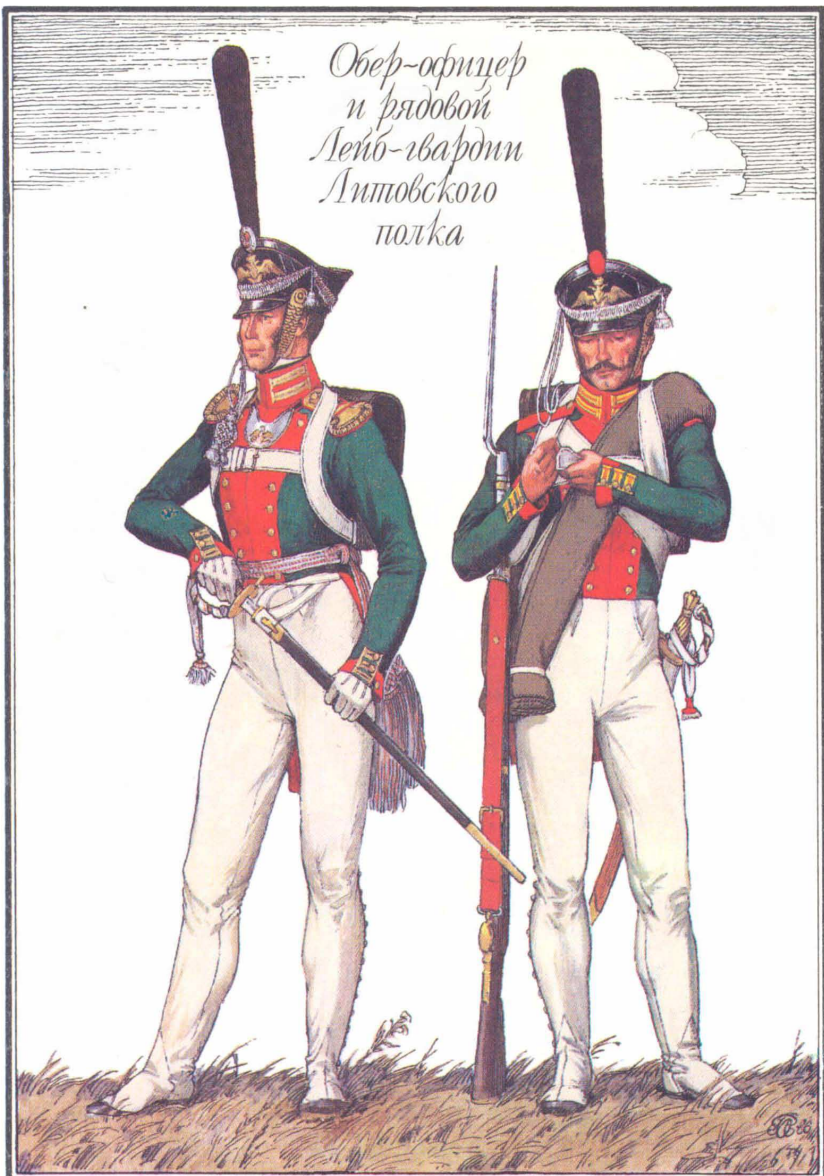
Обер-офицер и рядовой Лейб-гвардии Литовского полка