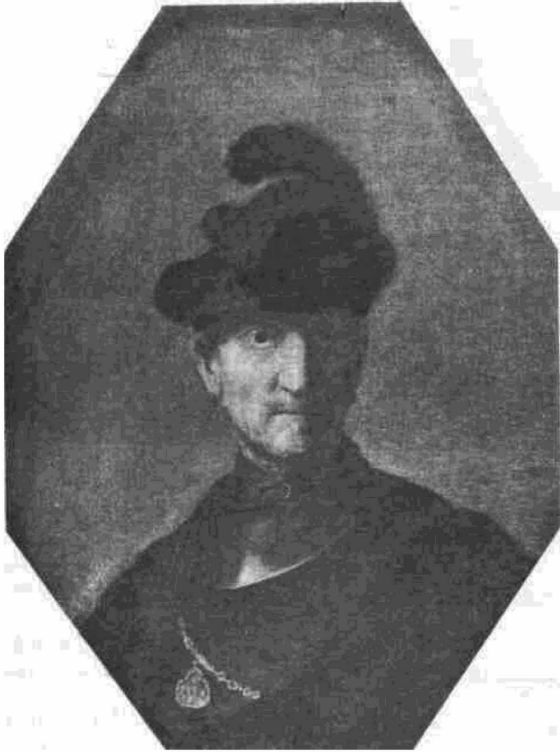
Портрет отца. Эрмитаж.

Искусство Рембрандта составляет великое наследие Голландии. Но значение его не ограничивается рамками одной национальности. Рембрандт из тех художников, чье творчество принадлежит к высочайшим проявлениям мировой культуры. Он одинаково велик, притом как в области живописи, так и графики. Оставленные им картины, гравюры и рисунки не менее