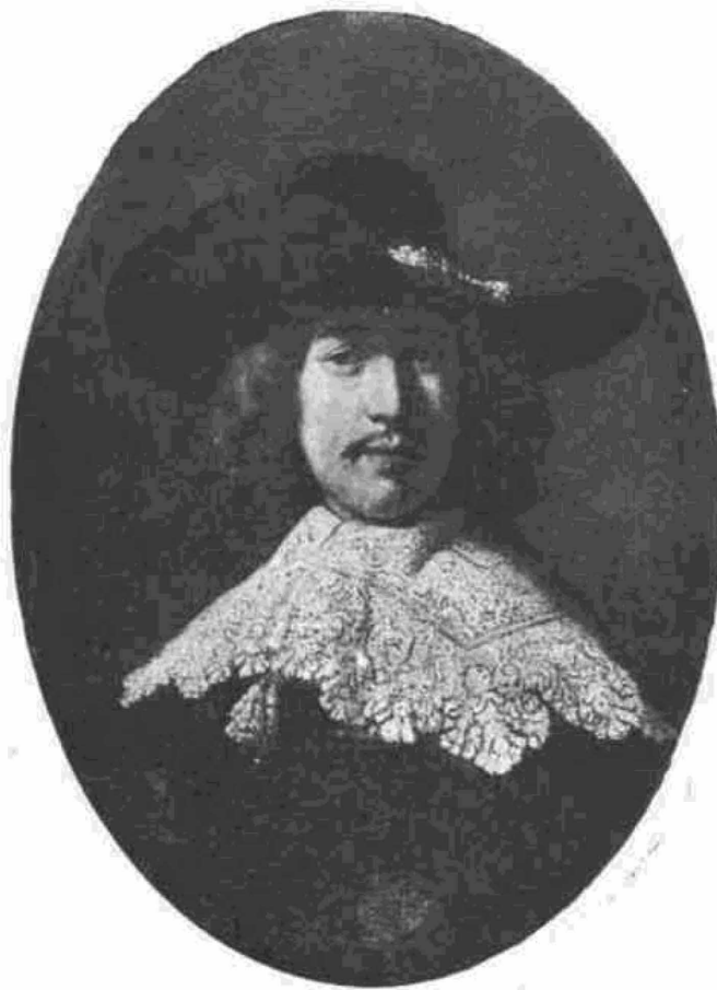
Портрет неизвестного. Эрмитаж.

Ограничению сферы господства живописи соответствовало сильнейшее оживление в другой ее области. Экономический рост страны не замедлил сказаться подъемом искусства. Мировоззрение господствующего класса определило его направление. Пришедшая к власти буржуазия несла свой реалистический идеал: правдивая передача внешних форм окружающей жизни, во всем многообразии ее явлений, становилась первейшей задачей художника. Человек и природа одинаково овладевали вниманием и не как выражение идей и символы, но ради них самих, как осязательные формы реального мира. Наблюдающееся теперь чрезвычайное распространение портрета являлось естественным следствием возросшего значения личности в новом буржуазном обществе. Длительный период борьбы, где победитель почувствовал свои силы, способствовал этому процессу. Он же обострил национальное чувство. От искусства требовалась теперь не только правдивость, оно должно было изображать свое: людей и обстановку сегодняшнего дня, картины родной неприкрашенной природы, все то, что привык встречать глаз—животных, обилие снеди, цветы и т. д.