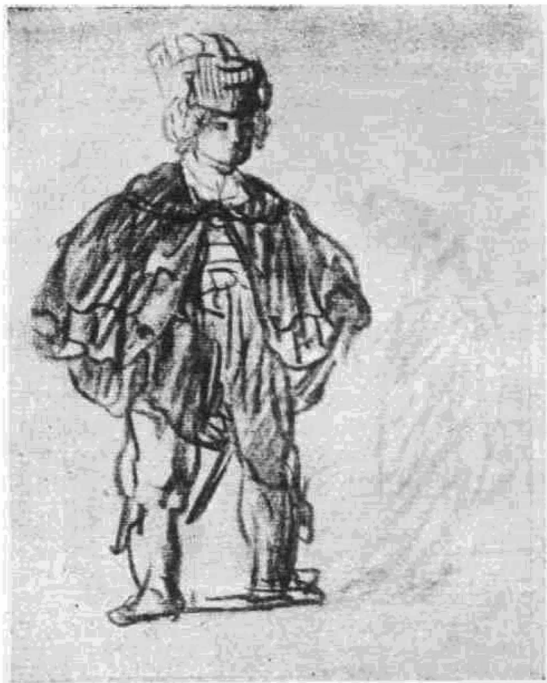
Этюд стоящего молодого человека. Рисунок. Эрмитаж.

Не всегда и не во всем достаточно ясно разграниченные, эти этапы соответствуют, в общем, внешним вехам биографии художника. Личная судьба мастера наложила свой отпечаток на его произведения и для познания творчества Рембрандта сведения о его жизни имеют существенное значение.