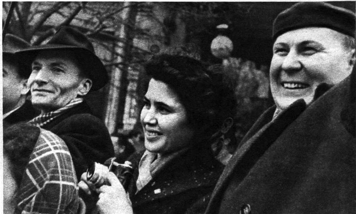
Москва, 7 ноября 1957 года. 1. Праздничная колонна трудящихся проходит по улице Горького. 2. Группа демонстрантов на Красной площади. 3. Идет спортивная молодежь столицы. 4. Зарубежные гости приветствуют демонстрантов на одной из московских улиц.