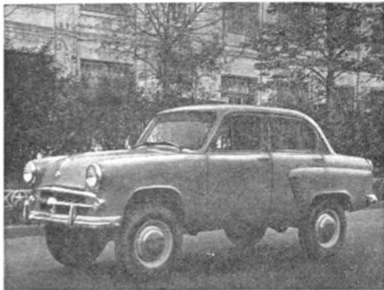
Рис. 1. Автомобиль «Москвич»-410