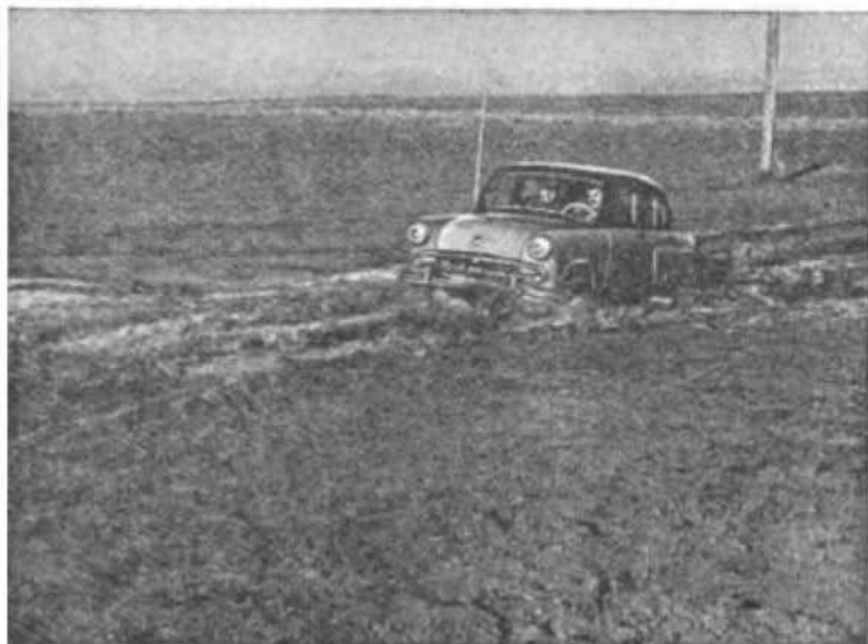
Рис. 4. Движение автомобиля по размытому участку дороги с глубокой колеей