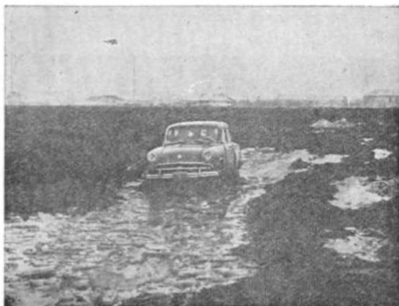
Рис. 3. Движение автомобиля по грязи

При проектировании нового автомобиля перед конструкторским коллективом завода стояла задача — создать автомобиль повышенной проходимости с максимально возможным использованием от стандартного автомобиля «Москвич» модели 402 основных деталей и узлов кузова и шасси. Это требование ограничило конструкторские решения и отразилось на внешнем виде автомобиля, его общих габаритных размерах, на конструкции некоторых агрегатов и отдельных узлов, а также на внутренних размерах пассажирского отделения кузова и его оборудовании. Требование создания автомобиля повышенной проходимости обусловило введение в его конструкцию дополнительных агрегатов — раздаточной коробки, дополнительных карданных валов и коренным образом изменило существующие на базовой модели автомобиля конструкции переднего моста, рулевого управления и передней подвески. Пришлось также пойти на частичное изменение основания кузова, подмоторной рамы, передних брызговиков и некоторых отдельных узлов.