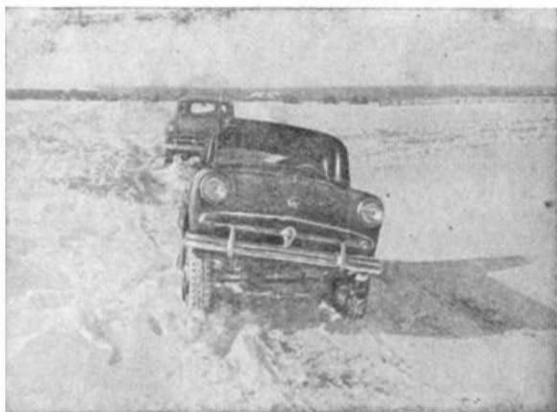
Рис. 5. Движение автомобиля по заснеженной дороге