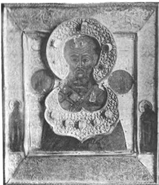
1. Образъ св. Николая, раб. Пансейна 1651 г. въ ц. св. Ильи Прор. въ Ярославлѣ..

свят. Николая (по поясъ) съ преп. Теодоромъ и Михаиломъ на поляхъ, 5) Соловец. Чудотвор. Ясими и Савватія, 6) Спаса на престолахъ, съ изображ. предстоящихъ: въ 1-мъ ряду Богородицы, Иоанна Предт., Арх. Михаила и Гавриила, Ап. Петра и Павла, двухъ Иоанновъ—Златоуст. и Милост., во 2-мъ—митроп. Петра, Алексія и Ионы, проп. Сергія, Варлаама, Дмитрія Прилуд., Макарія Унжен., Василия Блаж., 7) Николы Можайскаго, но изъ нихъ сохрани. только 4 и 7.