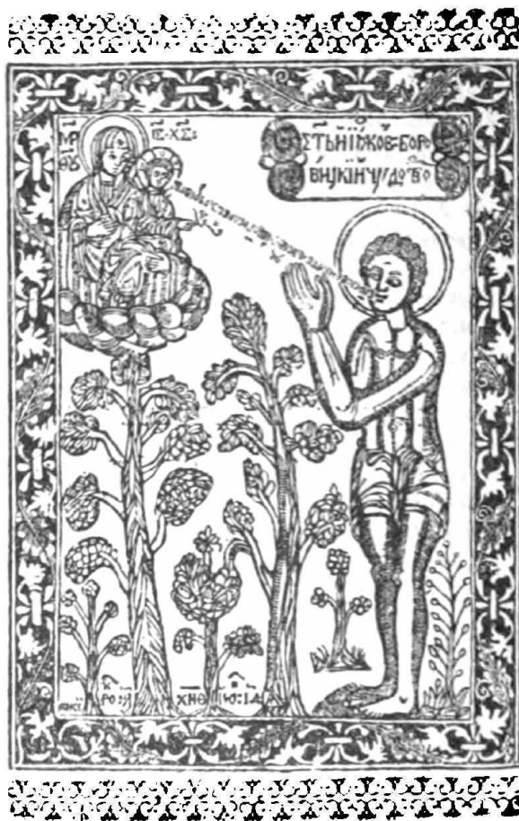
2. Изображеніе св. Іакова Боровицкаго, грав. Пансіемъ Сѣйскимъ 1659 г. (изъ „Рая Мысленнаго“).

Пансіѣ, старецъ, живописецъ XV в. Имъ, совмѣстно съ Діонисіемъ, его дѣтьми Теодосіемъ и Владміромъ, да двумя старцами, братаничами блаж. Іосифа—Доспѣевемъ и Гнесіапомъ, бывш. впослед. еписк. Коломенскимъ, подписана была какъ „пашчыми и хитрыми